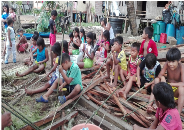
Figura 4. Jornada de con los niños del grado 2 de primaria.