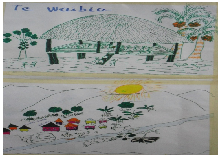
Figura 5. Recursos para el aprendizaje propio.