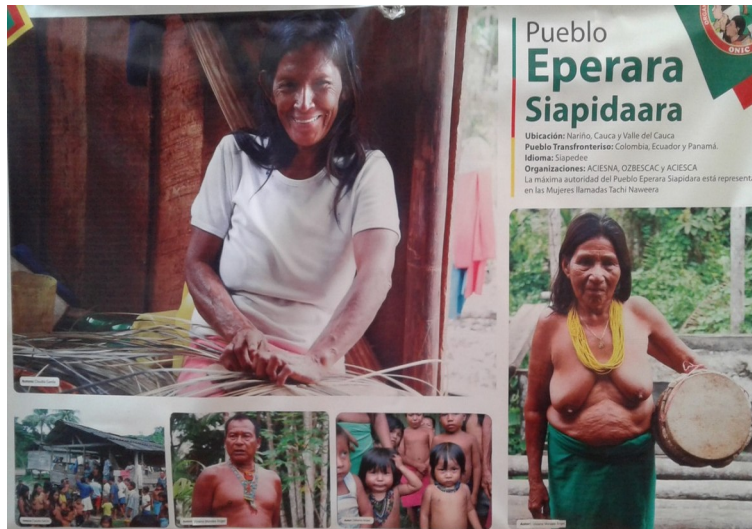
Figura 2. Feria de socialización