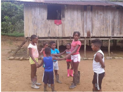
El gato y el ratón