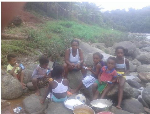
Salidas de campo