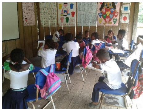
Figura 4. Vereda la Vega

Esta investigación se desarrolló en el consejo comunitario Alejandro rincón en la vereda la vega del municipio de barbacoas Nariño es una vereda un poco alejada del casco urbano donde para llegar a ella debemos hacer un recorrido bastante largo primero utilizamos un motor fuera de borda con canoas de láminas aproximadamente cerca de dos horas ,luego debemos coger una trocha de 6 y 7 horas de camino por lugares selváticos exponiéndonos a grandes peligros , al llegar a la vereda nos encontramos con un caserío pequeño de 7 casas incluida la casita que se utiliza como centro educativo el número de habitantes también es bastante reducido contamos con 14 personas adultas y 10 niños en el centro educativo aparte tenemos 10 niños menores de 5 años .el centro educativo la vega cuenta con unas condiciones de infraestructura regulares es una casa de madera no cuenta con baño ,bibliotecas, no tiene salas de informáticas el lugar recreativo es un poco alejado del centro educativo el número de estudiantes con los cuales se trabajó son 10 niños distribuidos en los diferentes grados los niños oscilan entre las edades de 8 y 10 años el centro educativo es oficial por estar tan alejado del casco urbano poco llegan las ayudas de las administraciones municipales