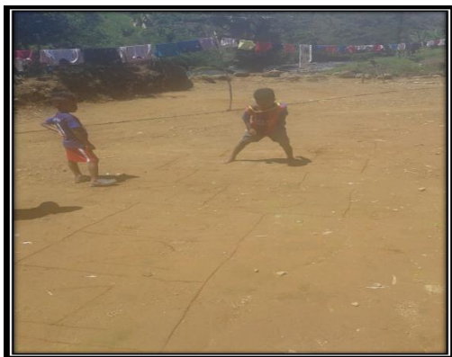
El pacha cajón