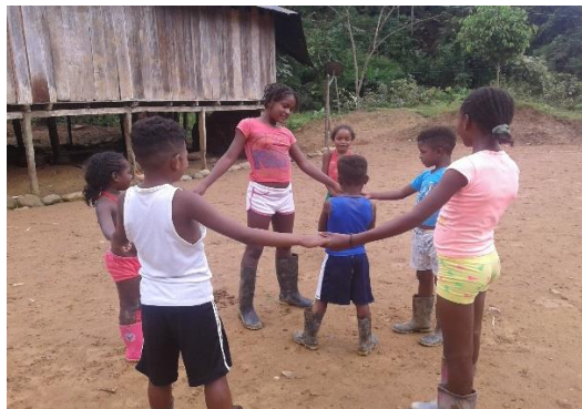
Figura 2. Estudiantes en el desarrollo de juegos tradicionales

Las figuras (fotografías, gráficos) que se quieran mostrar y que son pertinentes para el análisis que se está realizando, deben ser de tamaño moderado y se ubican en el centro del espacio. El título se escribe en la parte inferior, lo mismo que la fuente o procedencia. Ejemplo: