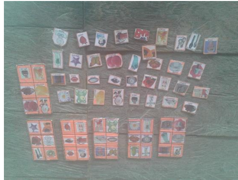
Figura 3. Recursos para el aprendizaje propio

En esta parte se redacta el proceso de diseño de la estrategia pedagógica.