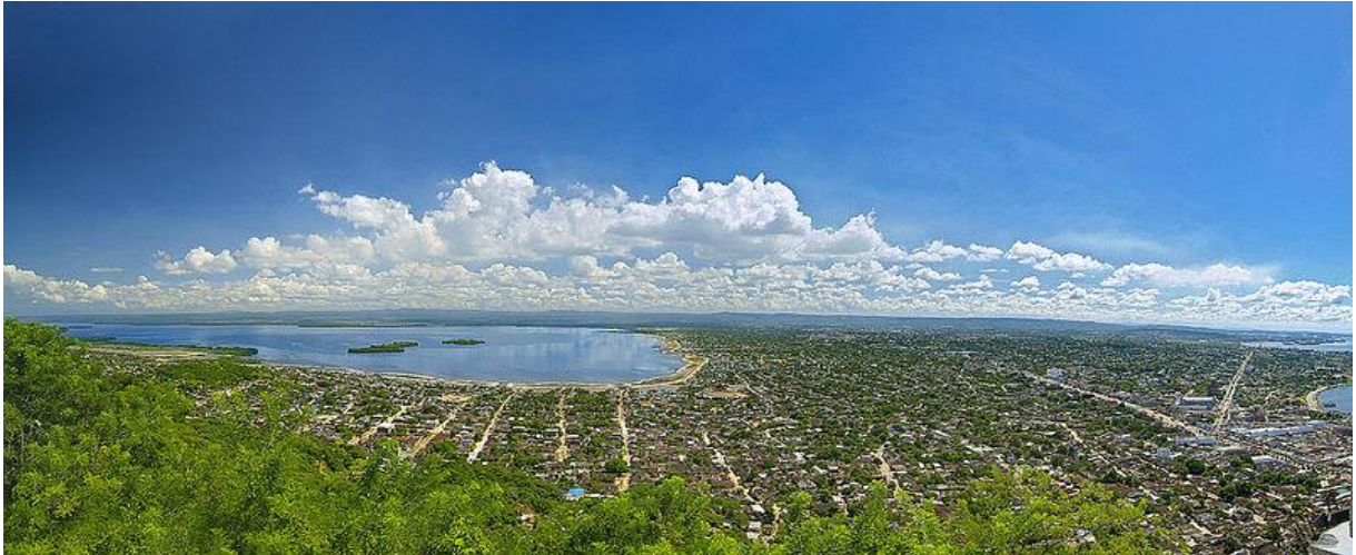
Figura 2: Panorámica de la ciudad de Cartagena.

No obstante, la condición de nuestra localidad; esta es epicentro del polo de mayor desarrollo y renovación urbana de la Ciudad de Cartagena de Indias, tiene una riqueza cultural y artística, que ha dado a conocer a esta ciudad en el plano nacional e internacional y por su privilegiada ubicación geográfica se encuentra en mira de inversionistas de todo el mundo para desarrollar proyectos urbanos, hoteleros y turísticos.