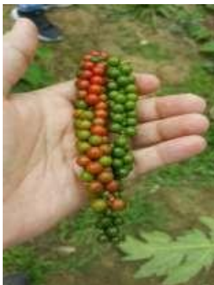
Figura N°3. Fruto