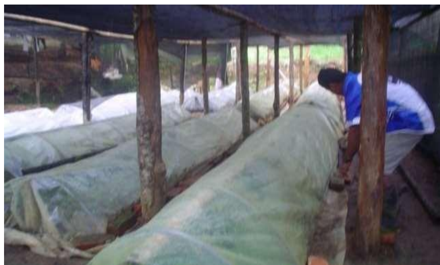
Figura N °9. Propagadores clónales