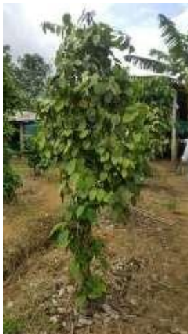
Figura N °8. Planta de pimienta