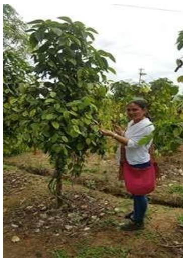
Figura N°2. Planta de pimienta