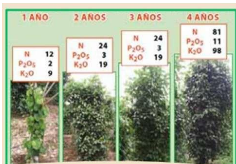
Figura N°4. Requisitos nutricionales de la pimienta.