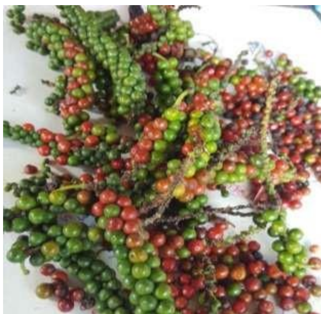
Figura N °12. Semillas Pimienta Negra