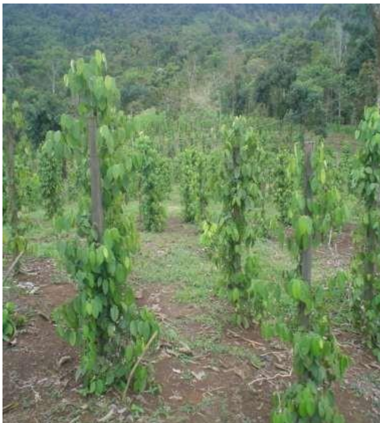
Figura N °11. Plantación Pimienta Negra