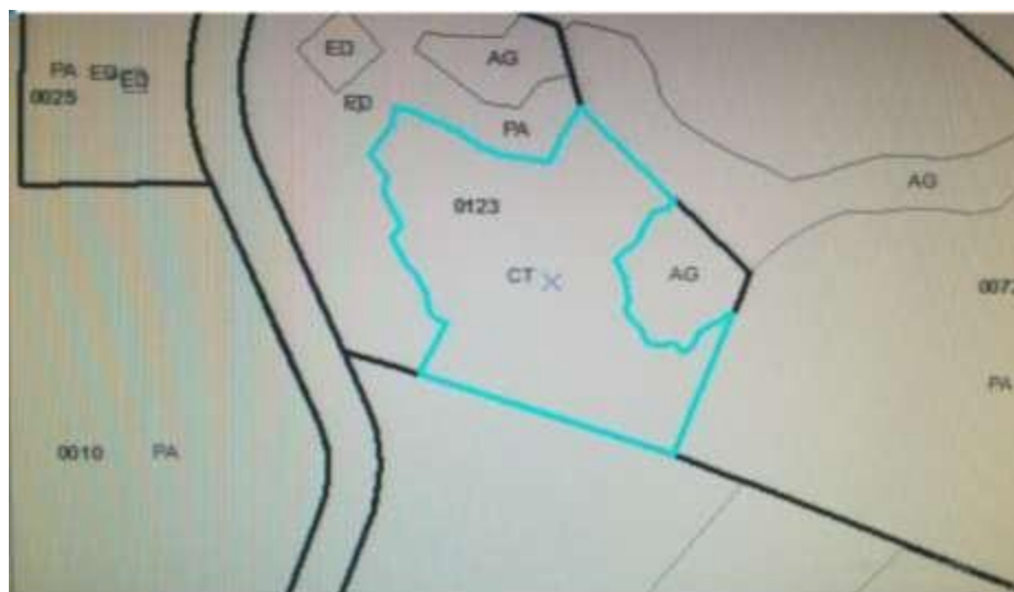
Figura N° 6. Área del cultivo 10.873 m 2