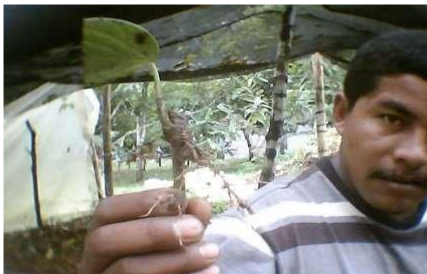
Figura N °10. Estacas enraizadas