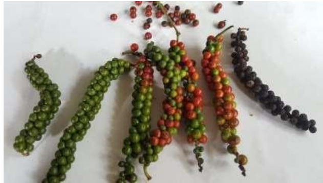
Figura N°1. Semillas de pimienta