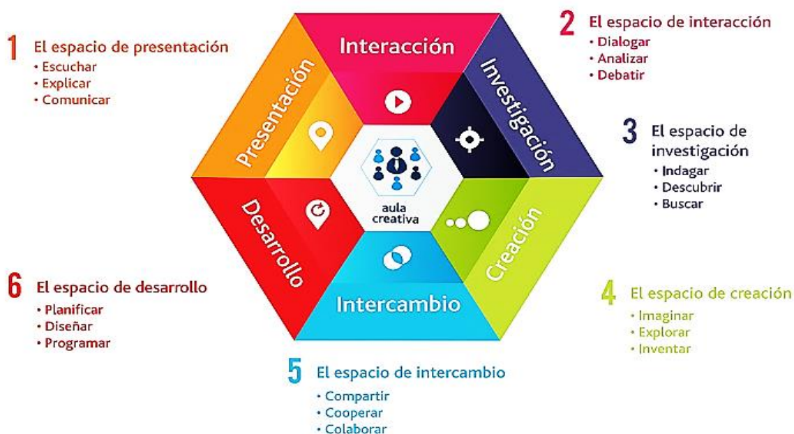
Diagrama 2. Las Aulas del Siglo XXI: Los Nuevos Escenarios del Aula Creativa

Buscar estrategias para responder a la diversidad, lo cual puede propiciar la pertenencia y la participación de los sujetos en cada una de las instituciones y de esta manera lograr la equidad social, reconociendo las necesidades y generando programas que permitan el desempeño exitoso de los estudiantes y luego su inserción exitosa en lo social y laboral. (Acevedo, 2013, p.3)