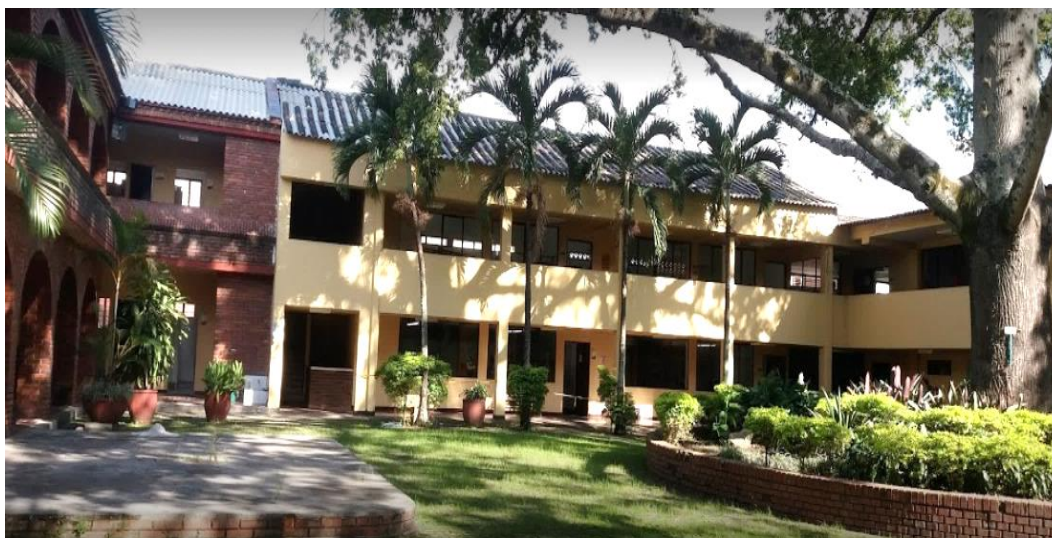
Fotografía 2. Escuela Municipal de Arte Ricardo Nieto

Dada que la población de Palmira es amplia, se especifica que el análisis de la situación de educación inclusiva se focaliza específicamente en los niños y adolescentes en condición de discapacidad que pertenecen a la Escuela Municipal de Arte Ricardo Nieto, atendiendo a personas con condición especial en aspectos como: Movilidad reducida, limitación visual, limitación auditiva, limitación expresiva/habla y limitación cognitiva para un total de 118 personas con diversidad funcional, 73% es de zona urbana y 27% de zona rural .