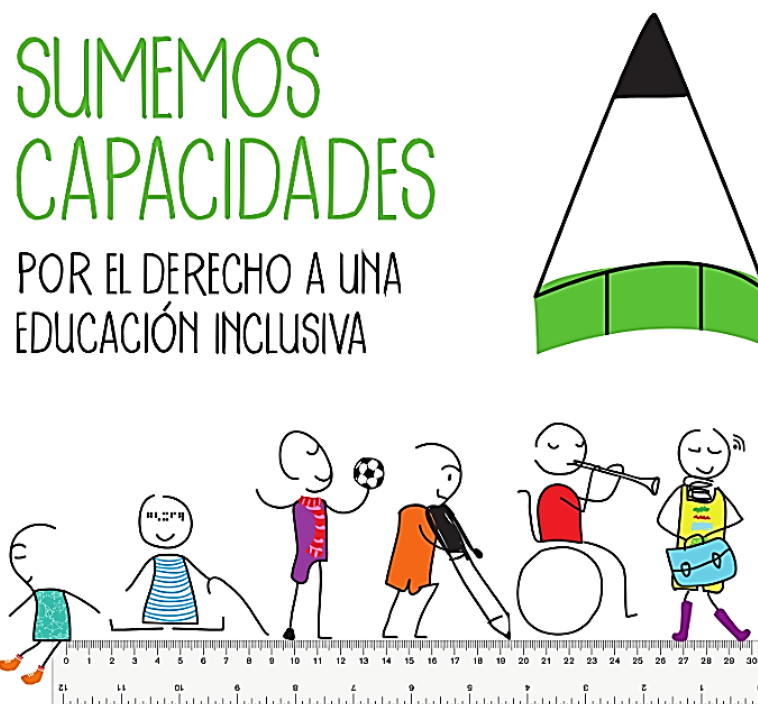
Ilustración 2. Derecho a una educación inclusiva de los niños y niñas con discapacidad

Establecimiento de acciones, adaptaciones, estrategias, apoyos, recursos o modificaciones necesarias en el sistema educativo y la gestión escolar, basadas en necesidades específicas de cada estudiante, [...], y que se ponen en marcha tras una rigurosa evaluación de las características del estudiante con discapacidad. A través de estas se garantiza que estos estudiantes puedan desenvolverse con la máxima autonomía en los entornos en los que se encuentran, y así poder garantizar su desarrollo, aprendizaje y participación. (p. 4)