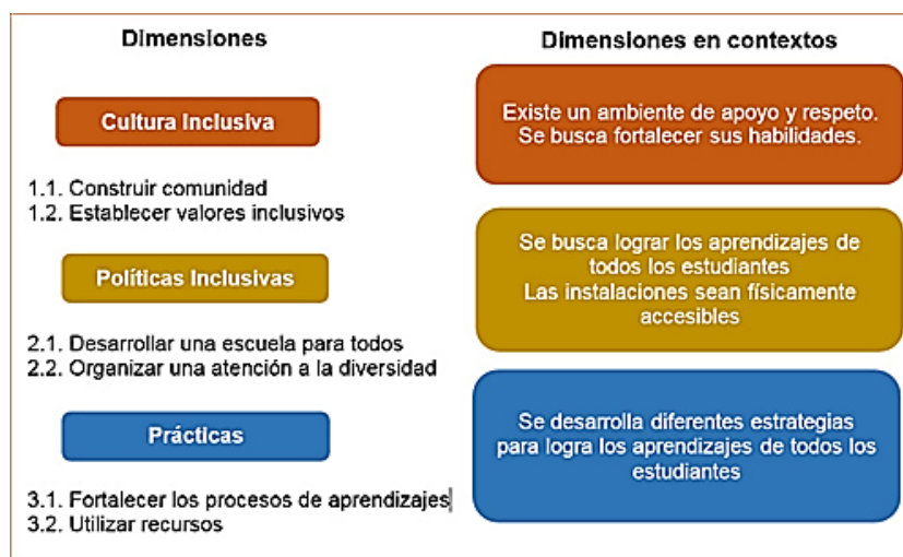
Diagrama 6. Modelo para fortalecer la educación inclusiva

Garantizar una educación inclusiva y equitativa de calidad promoviendo oportunidades de aprendizaje permanente para todos... al eliminar las disparidades de género en la educación, garantizado el acceso a las personas vulnerables y asegurado la inclusión de las personas con discapacidad. (p.14)