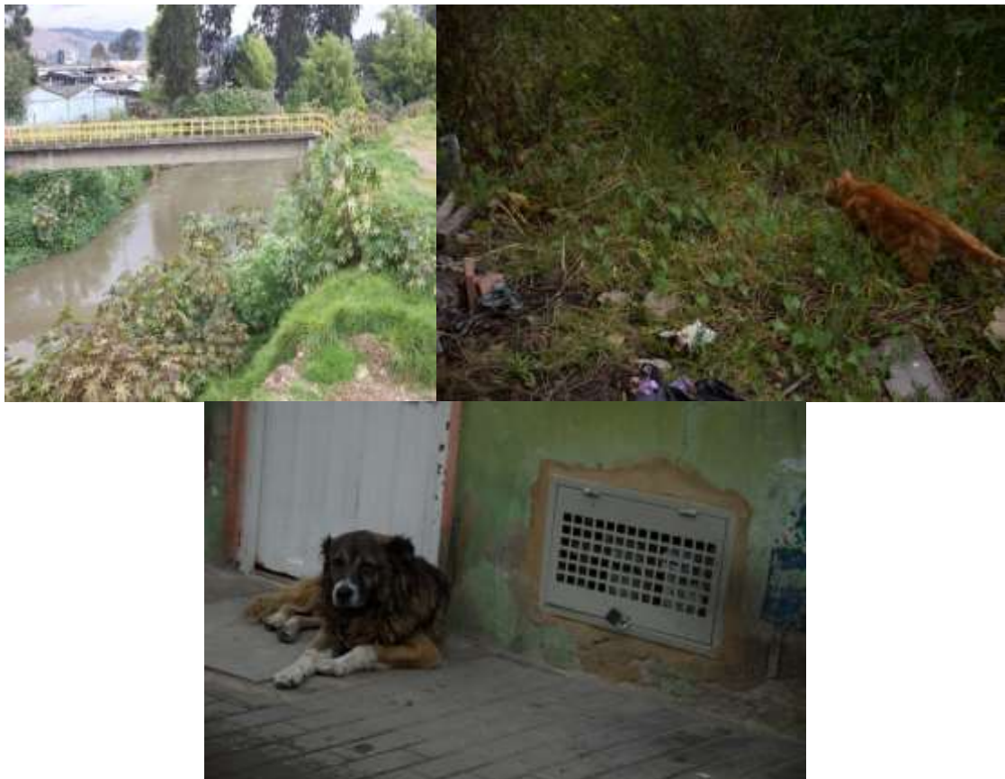
Recorrido Localidad de Bosa, Bogotá D.C.

En cuanto a las sesiones de cartografía varios hallazgos importantes se pudieron notar con una sencilla salida a barrios aledaños, inicialmente lo que por medio de la observación se puede analizar, zonas de completo abandono donde se está volviendo botadero de basuras a pesar que en la zona está prohibido, una cantidad alta de calles y avenidas las cuales no están pavimentadas a pesar de ser corredores principales, una cantidad importante de contaminación visual por campañas políticas de cámara y senado, una alarmante cantidad de animales callejeros.