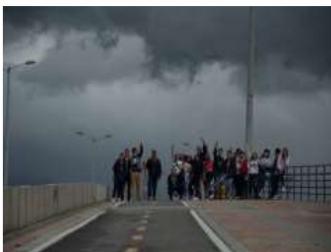
Salida de Campo, Localidad de Bosa, Bogotá D.C.

Pero esto son problemáticas las cuales ya todos conocen y que de cierta forma ya se aprendió a vivir con ello; lo que realmente sorprende son algunas actividades clandestinas en focos importantes de la localidad y que solo salieron a la luz en la construcción de la cartografía social; algunos de las graves problemáticas que fueron evidenciadas a través de la cartografía social fueron las peleas clandestinas de gallos y perros, la cantidad de “ollas” o lugares para la distribución de droga, venta fácil de droga legal a menores de edad en ciertos establecimientos.