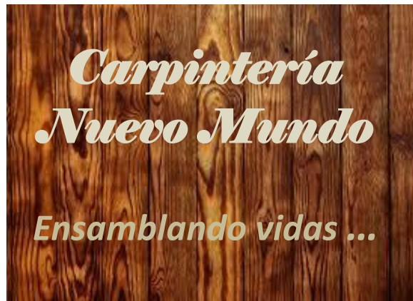
Imagen de la marca y slogan seleccionado por el grupo

Presentación del enlace del Wix con los elementos solicitados