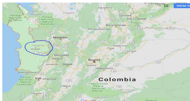
Ilustración 4 Ubicación alternativa de solución