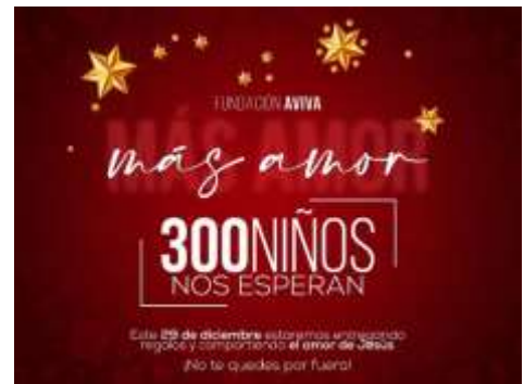
Imagen publicitaria Más Amor