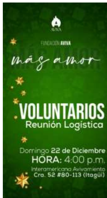
Imagen de Convocatoria Voluntarios