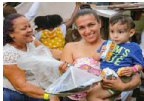
Madre beneficiada y Lider comunitaria