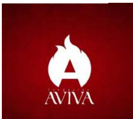
Logo con diseño para campaña.