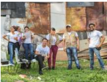
Voluntarios Fundación Aviva