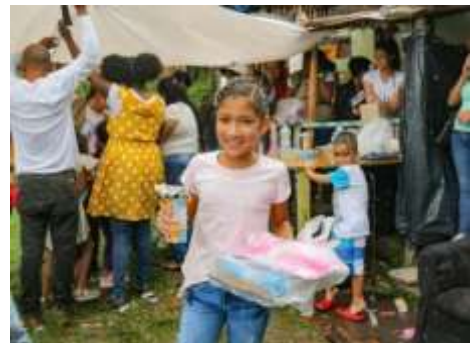
Beneficiara de la Fundación.