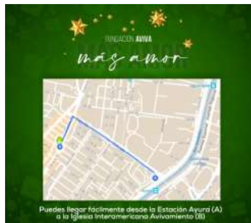
Mapa del punto de encuentro, Voluntarios