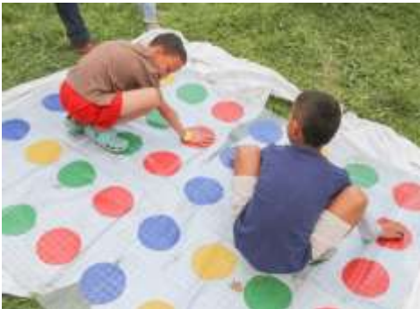
Niños disfrutando actividades lúdicas.

La ejecución de esta campaña contó con la conformación de equipos con responsabilidades específicas que facilitaron la labor logística para lograr el objetivo primordial: La gente y su beneficio.