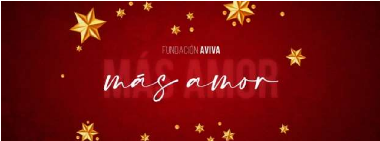
Diseño para Cover Redes Sociales

Una vez, las piezas gráficas fueron diseñadas, se publicaron en la Fan Page de la fundación Aviva en Facebook durante la campaña, puede verse en este sitio web: