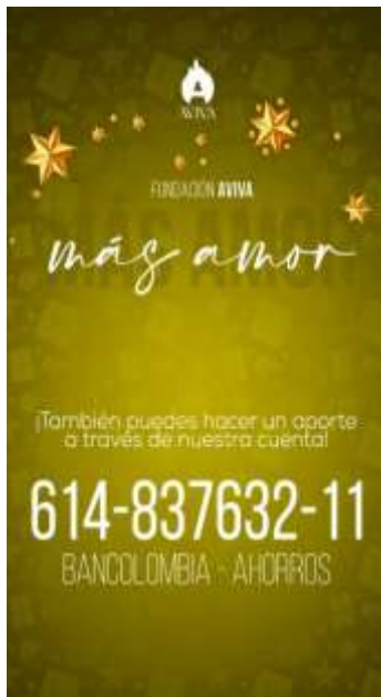
Imagen de recaudación Más Amor

De manera simultánea, acompañé a los voluntarios de la fundación encargados del diseño gráfico para realizar una agenda editorial para ser utilizando en redes sociales como Facebook y redes sociales internas como WhatsApp y estaría dirigida a difundir la campaña de recolección de regalos, la convocatoria de voluntarios y la posterior publicación del resultado de esta acción social; logrando el diseño de las siguientes piezas gráficas: