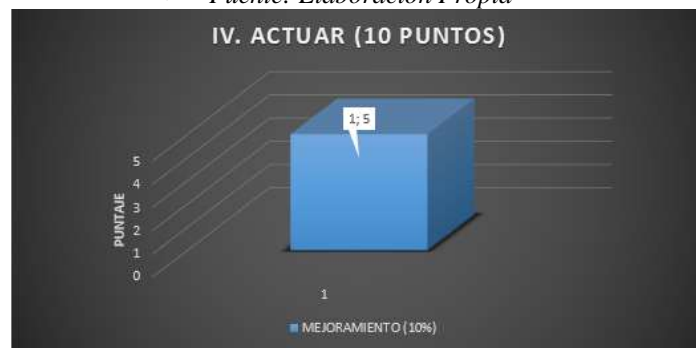
• Figura 6. Resultados obtenidos en la fase Actuar en la empresa

Se realizó la evaluación de los estándares mínimos de SGSST al área de RRHH, verificando que cumpla los requerimientos internos y se ajuste a la normatividad establecida para cubrir los riesgos a los cuales están expuestos todos los empleados, según el decreto único reglamentario del sector trabajo, que fue actualizado en 2018, Decreto 1072 de 2015.