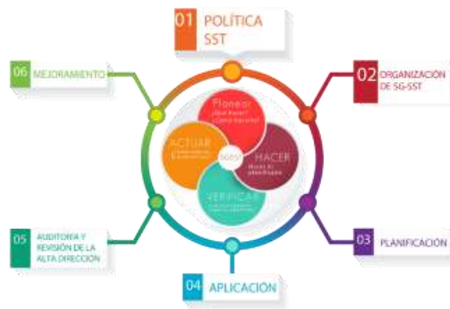
Figura x. SG-SST integrado con el ciclo PHVA. Fuente: (a&a consultores, 2017)

Teniendo en cuenta los enfoques anteriormente mencionados se puede mostrar el Sistema de Gestión de Seguridad y Salud del Trabajo integrado con el Ciclo PHVA de los procesos.