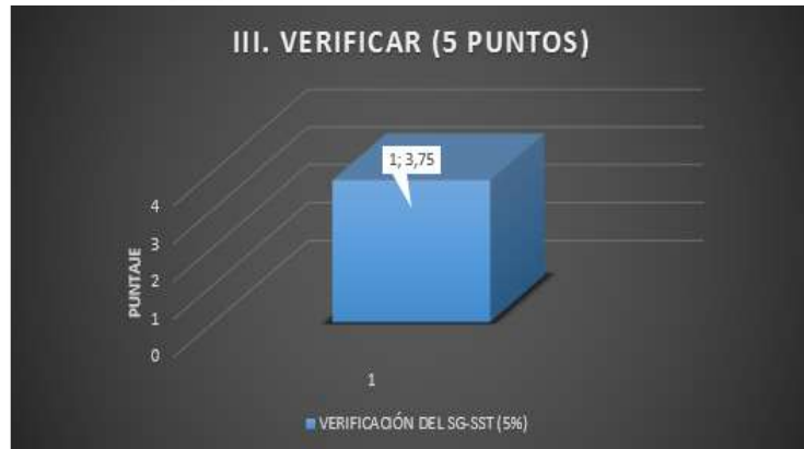
• Figura 5. Resultados obtenidos en la fase Verificar en la empresa