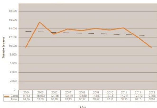
Figura 2. Violencia contra niños, niñas y adolescentes, casos y tasas por 100.000 menores de 18 años. Colombia, 2004-2013

desde el 2004 hasta el 2013, se evidencia tendencia al descenso que presenta la violencia al interior de la familia.