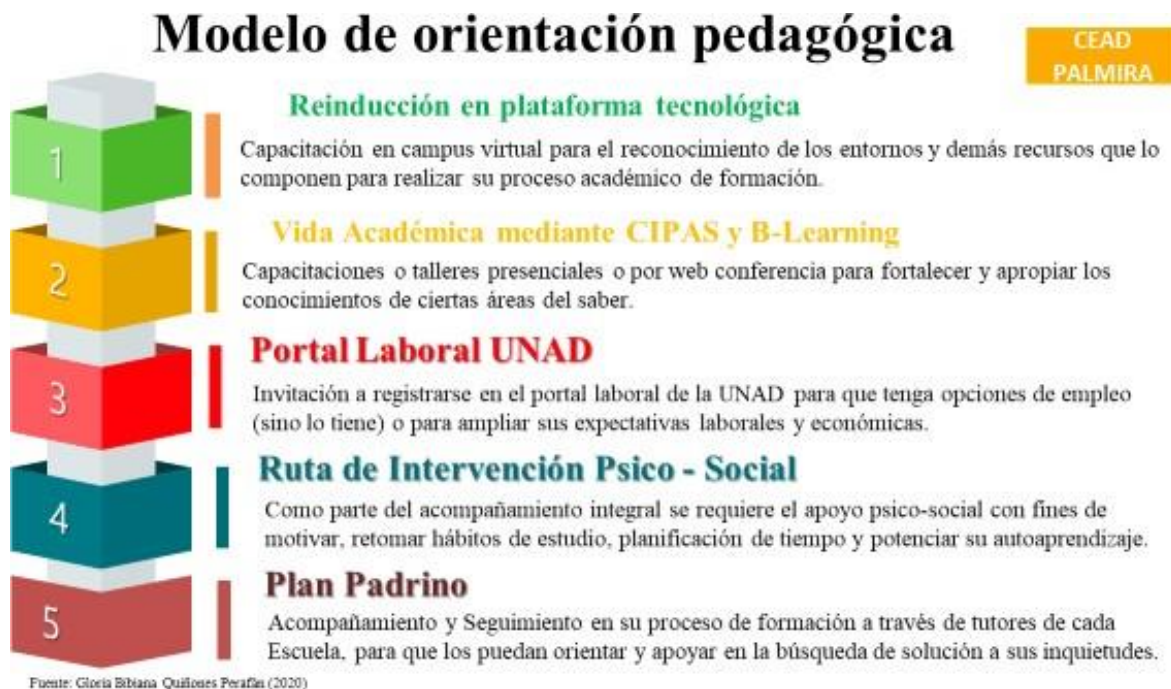
Tabla 5 Modelo de orientación pedagógica para la activación de los estudiantes en condición de rezago del CEAD Palmira

Nota de la Figura 2. Modelo de orientación pedagógica para la activación de los estudiantes en condición de rezago del CEAD Palmira