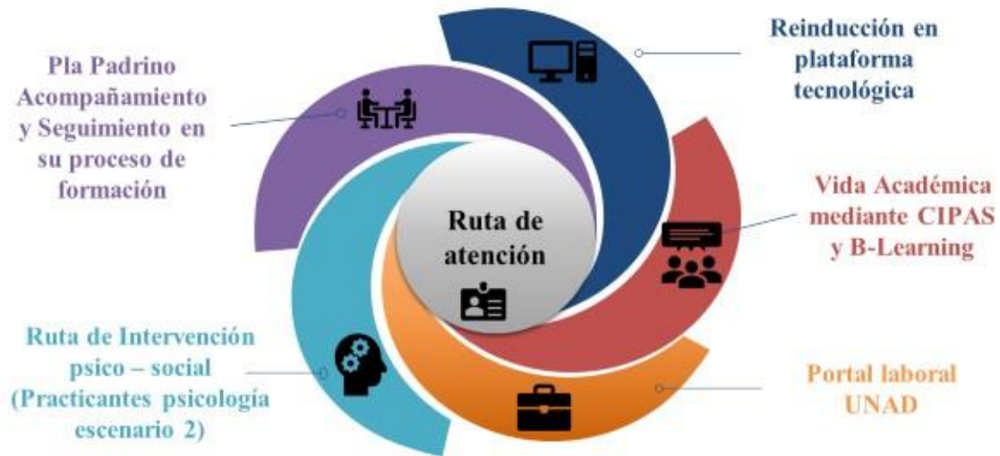
Figura 2 Modelo de orientación pedagógica