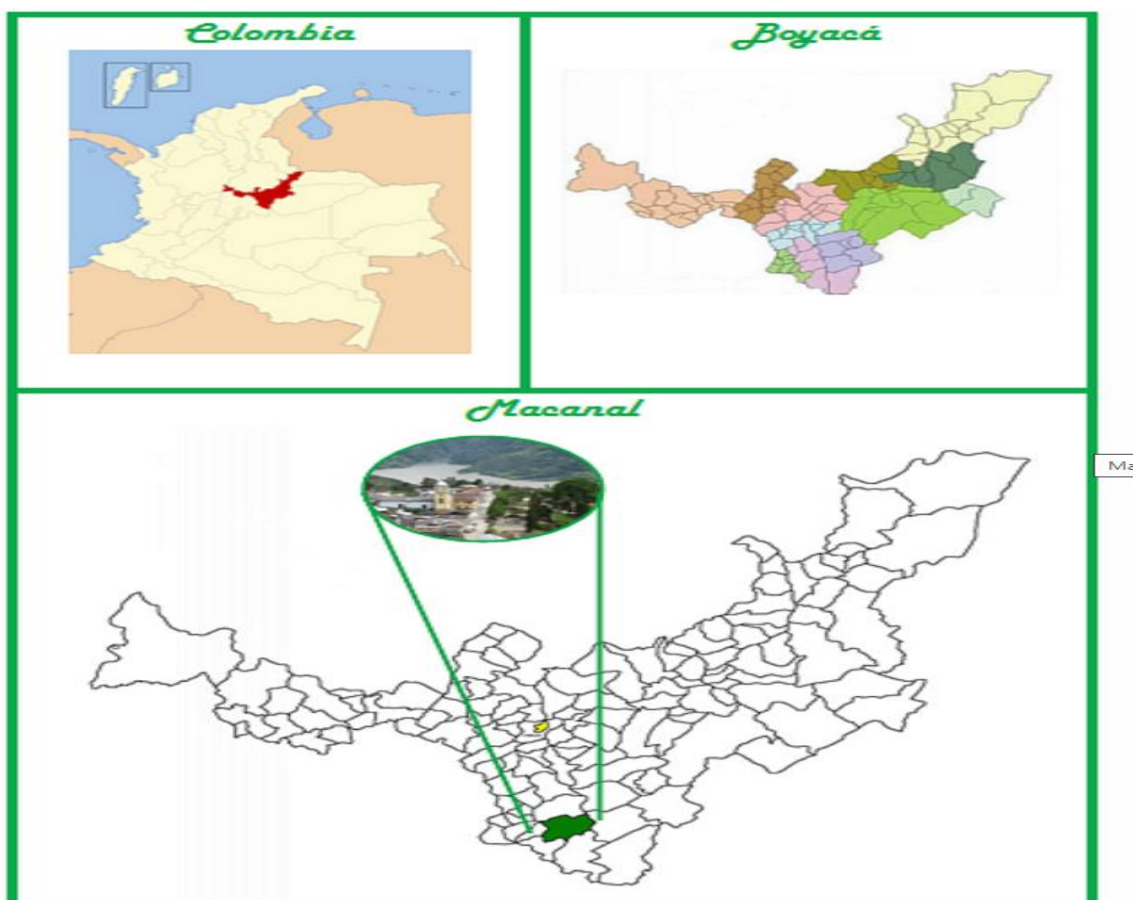
Figura 1. Municipio de Macanal, Departamento de Boyacá.

El marco espacial donde se realiza la aplicación del proyecto es la empresa de Servicios Públicos Manantial S.A, ubicada en carrera 6 No. 2-73, Barrio La Ceiba en el municipio de Macanal, Departamento de Boyacá,