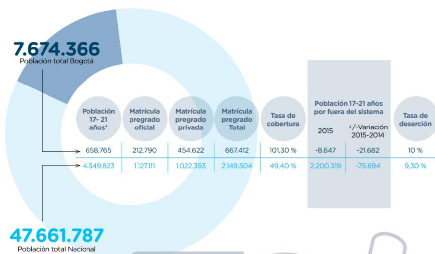
Imagen 3. Cobertura en Educación Superior 2015

Nota. Tomada de: Secretaria de Educación de Bogotá. (2016). Plan Sectorial de Educación 2016 – 2020 “Hacia una ciudad educadora” . pp 38