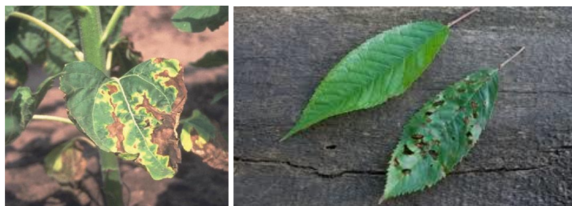
Figura 3. Necrosis en hojas (Mainwaring, 2012)

sólidas no tóxicas, que actúan positivamente en algunos tipos de vegetales, siendo una forma de nutrición ya que sus propiedades químicas pueden contener nitratos que desarrollan las propiedades positivamente (Castelo, 1994).