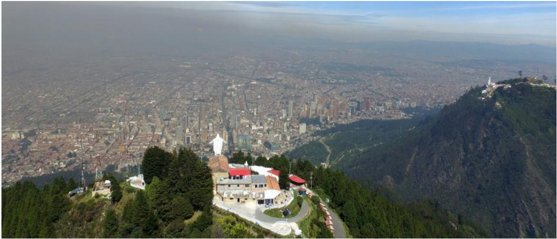
Figura 4. Reducción de la visibilidad paisajística en la ciudad de Bogotá (Sepúlveda & Ortega, 2017)