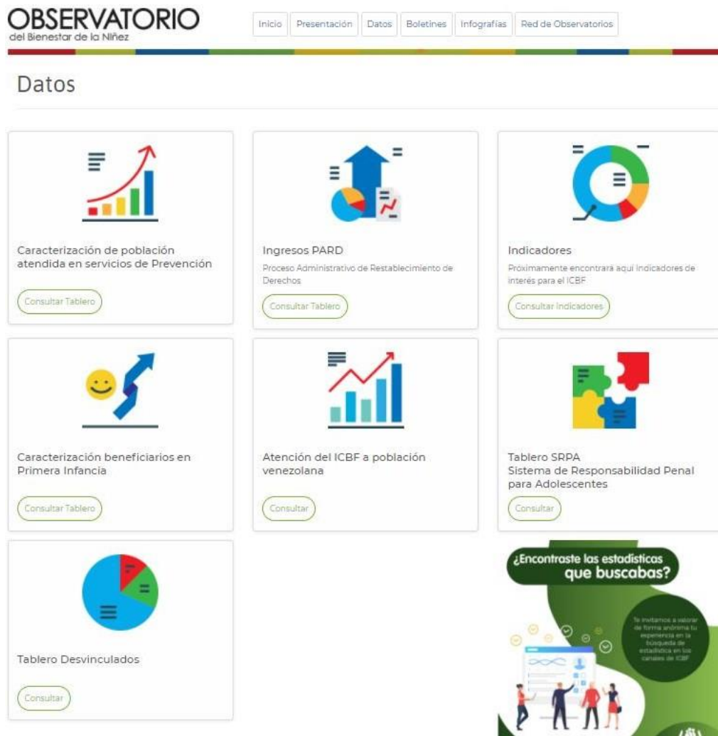
Figura 2. ICBF - Observatorio del Bienestar de la niñez.