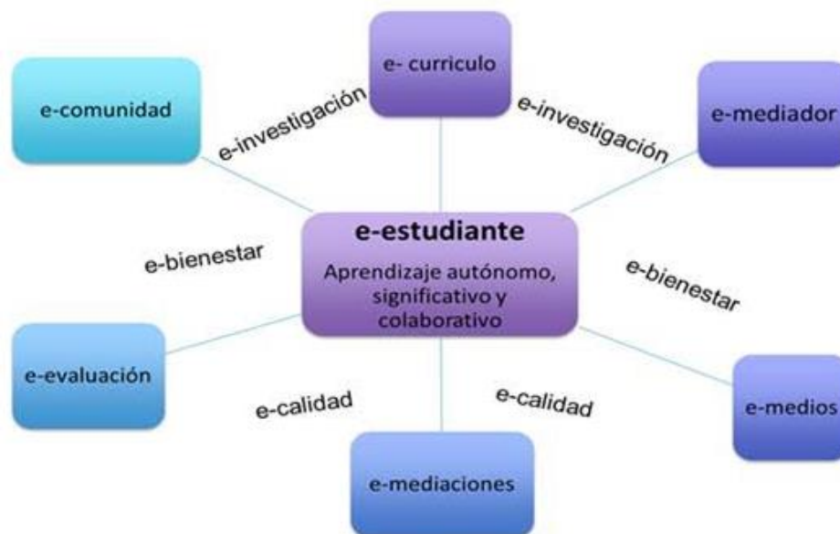
Figura 3. Modelo académico UNADISTA Apoyado en e-learning

Nota: Universidad Nacional Abierta y a Distancia (2016)