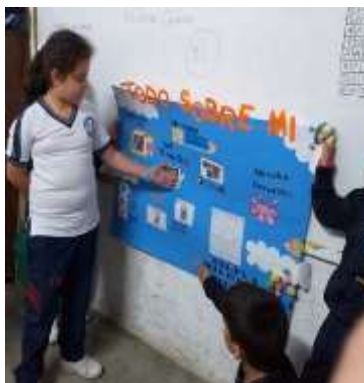
Figura 6 Estudiante con hidrocefalia y espectro autista relatando su vida