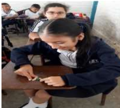
Figura 9 Estudiante con discapacidad cognitiva moldeando plastilina