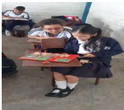
Figura 8 Estudiante con discapacidad cognitiva armando rompecabezas