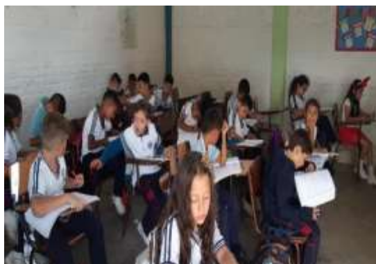
Figura 10 Estudiantes en actividades cotidianas de clase