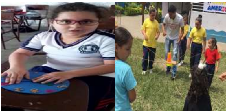
Figura 5 Estudiante con hidrocefalia y espectro autista, realizando el reloj