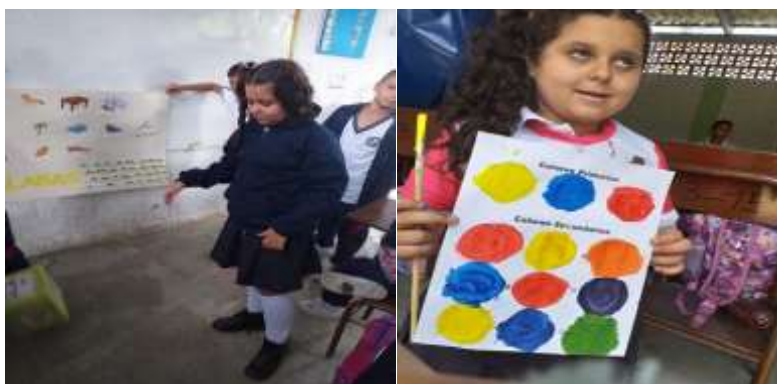
Figura 4 Estudiante con hidrocefalia y espectro autista, realizando combinaciones con colores

trabajar su desarrollo motor, brindándole la posibilidad de destacar sus capacidades tanto físicas como cognitivas. Así mismo se realizaron trabajo de integración social con demás estudiantes del grado tercero, haciendo énfasis en este aspecto, pues este tipo de discapacidades presentan bastante dificultad, debido a que tienden a ser opositorista – negativista. De esta manera, por medio de estrategias como la realización de relatos a sus compañeros sobre su vida familiar, gustos y pasatiempos. Se logró un mayor acercamiento y se verifica el progreso obtenido con los materiales utilizados.