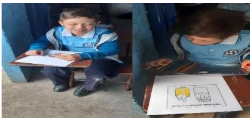
Figura 3 Estudiante con Síndrome de Down coloreando

Así, el niño logró reconocer el abecedario por medio de este tipo de metodología, y de acuerdo a lo propuesto como meta, posteriormente logró unir palabras y desarrollar competencias de lectoescritura y poder en la medida colorear diferentes imágenes que le posibilitaron discriminar cantidades como pocos o muchos. También mostro avances en el reconocimiento de género, al colorear una mándala el cual le facilito controlar sus movimientos convirtiéndose en una actividad divertida, debido a que no genero estrés en el niño y logro estados de tranquilidad y relajamiento. De esta forma, se constata que al programar este tipo de actividades con elementos diversos el accionar del niño en el aula permite a éste reconocer estímulos y generar respuestas mostrando un avance.