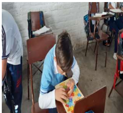
Figura 1 Estudiante con Síndrome de Down desarrollando rompecabezas