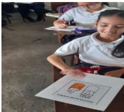
Figura 7 Estudiante con discapacidad cognitiva coloreando cantidades