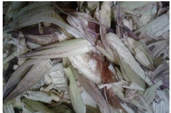
Ilustración 2 residuos Hoja de Maíz tierno