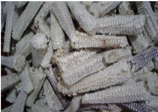
Ilustración 1 residuos Tusa de Maíz

un buen aprovechamiento del contenido de nutrientes que fortalece el crecimiento y peso del animal, también puede decir que estos nuevos productos a base de residuos agroalimentarios contribuyen al mejoramiento de la productividad y competitividad de la región articulando y armonizando, a través de las políticas nacionales y regionales que fortalecen el sector agroalimentario.(PDEA 2019). También el maíz y sus residuos es actualmente usado como ensilaje para ganado lechero este tiene un alto contenido de energía, fibra y proteína que ayuda a complementar el alimento en épocas de verano o invierno esta es una gran alternativa en el mejoramiento de la ración suministrada este ayuda a mejorar rendimiento de producción de leche y carne y disminuye los costos utilizados en concentrados.(Fabián Martínez 2019).