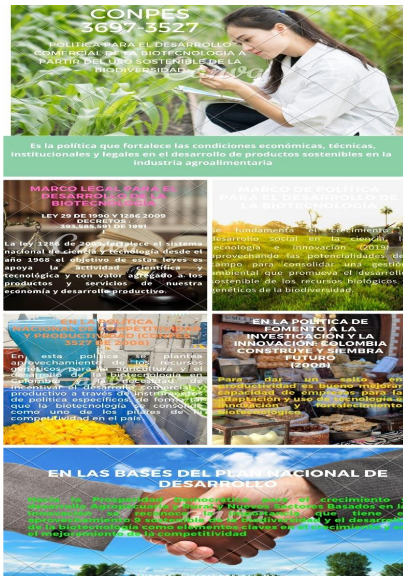
Ilustración 6 CONPES 3697- 3527 normativa nacional en el desarrollo de productos y procesos biotecnológicos