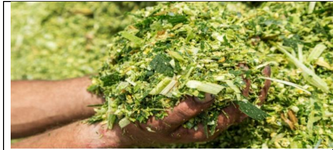
Ilustración 5 optimización de ensilaje a base de residuos tusa y hojas de maíz tierno

BAC que se relacionan con el proceso de ensilaje pertenecen a los géneros: Lactobacilos, Pediococcus, Leuconostoc, Enterococcus, Lactococcus y Streptococos. En su mayoría son mesó filas, que pueden prosperar en un rango de temperaturas que oscila entre 5° y 50 °C, con un óptimo entre 25° y 40 °C. Son capaces de bajar el pH del ensilaje a valores entre 4 y 5, obedeciendo de las especies y tipo de residuos Agroalimentarios a ensilar (Noguer & Vales, 1977).