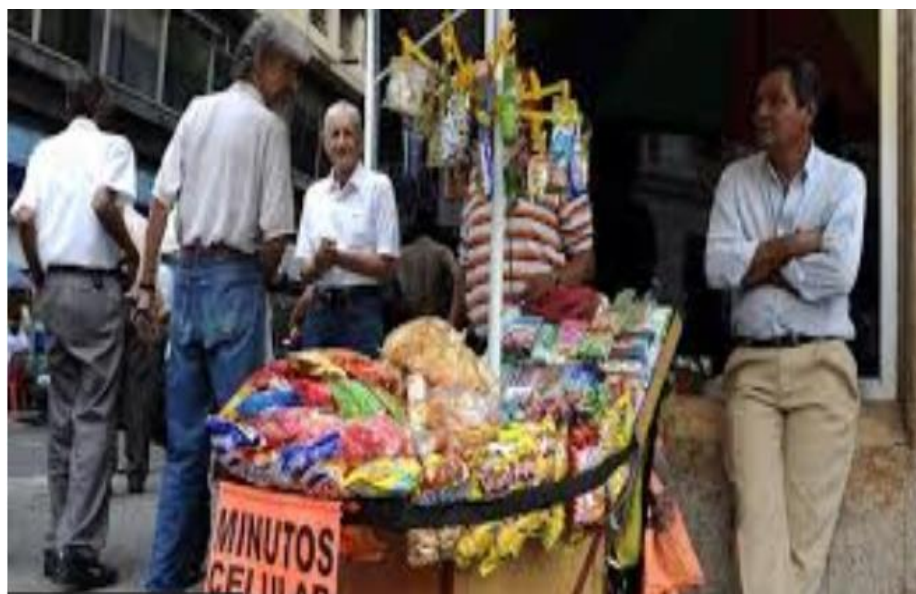
Figura 3 Empleo informal