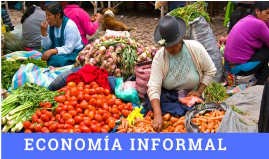
Figura 2: Economía informal