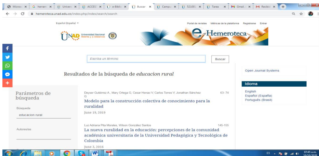
Ilustración I. Base de datos e-Hemeroteca. UNAD. Autoría propia.

En Google Scholar, se encuentra cerca de 91.100 resultados como lo muestra la siguiente captura de pantalla a nivel mundial, relacionados con la educación y aislamiento social por COVID-19.