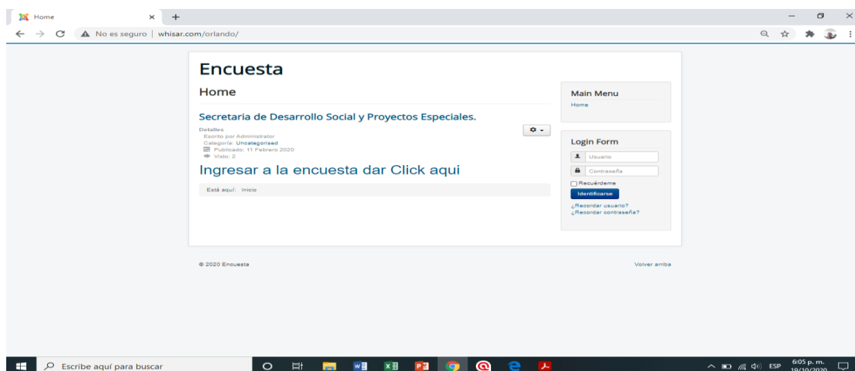
Figura 1. Blog de entrada para recolección de información.

Para recolectar los datos se colocó la información en un sitio web para facilitar el trabajo de los encuestadores y procesamiento de información usando la herramienta de formularios de Google.