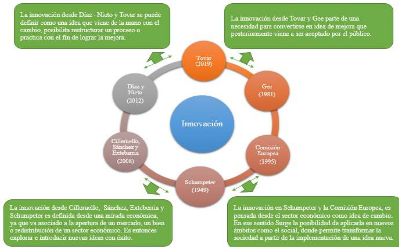
Figura 1 Concepto de Innovación desde diferentes pensadores.