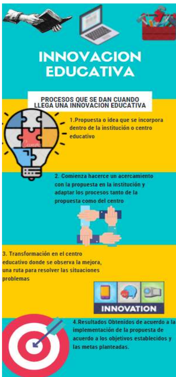
Figura 2 Procesos que se desarrollan con la llegada de la innovación.

Nota. 2 Elaboración propia a partir de los planteamientos del autor Wilfrido Riomari (2000)