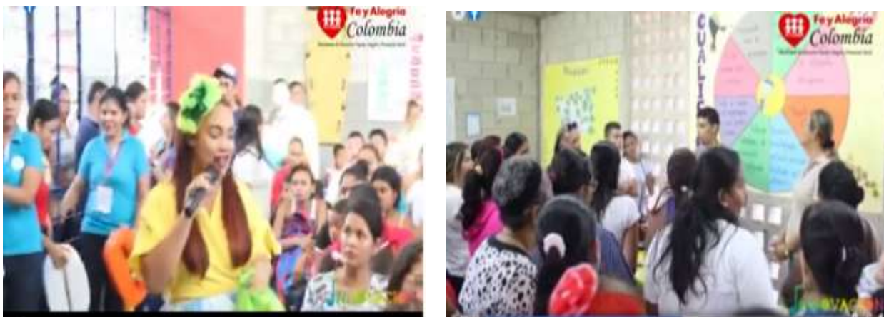
Figura 6. Imágenes del proceso que se lleva empoderamiento de parte de los docentes de la institución y socialización a padres de familia.

Con la propuesta educativa, los docentes participan de forma dinámica, creando nuevas prácticas al momento de transmitir sus conocimientos e ideas, se vincula la comunidad educativa dentro del proceso institucional y se socializan constante de los procesos institucionales.