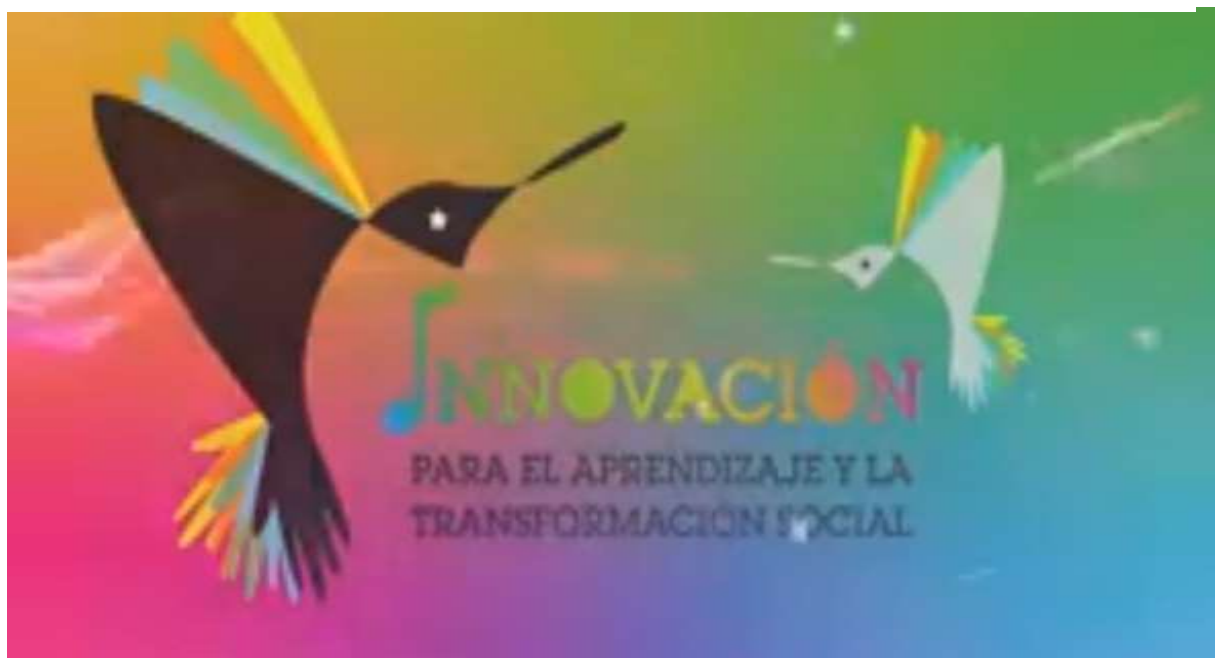
Figura 5. Logo de la propuesta de innovación para el aprendizaje y la transformación social

Nota. 6 Tomado de la página de Facebook de la institución donde se presenta el logotipo de la propuesta de innovación.