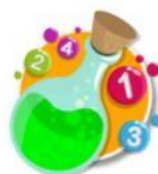
Números en inglés