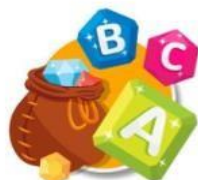
Abecedario en inglés

Bienvenidos a nuestra área de inglés para niños. En un mundo conectado por la tecnología, aprender inglés provee a los niños un futuro con oportunidades profesionales y sociales más amplias y una visión más profunda del mundo. Al hablar español podemos comunicarnos con aproximadamente 437 millones de personas, pero el inglés nos permite comunicarnos con 1.5 billones de personas. En Árbol ABC te invitamos a compartir nuestros juegos de inglés para niños con tus hijos o alumnos. ¡Aprender inglés será muy divertido!