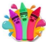
Los colores en inglés