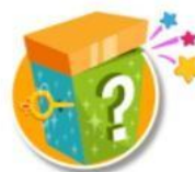
Adivinanzas en inglés