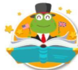
Cuentos en inglés