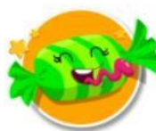
Trabalenguas en inglés

Nota: Interfaz de las diferentes posibilidades didácticas de juegos de inglés para niños.