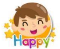
Vocabulario en inglés