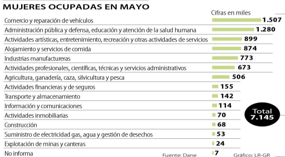
Ilustración 1-Muestra la cantidad de Mujeres Ocupadas en Mayo