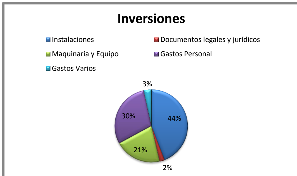
Ilustración 4 - Gráfico de Inversiones