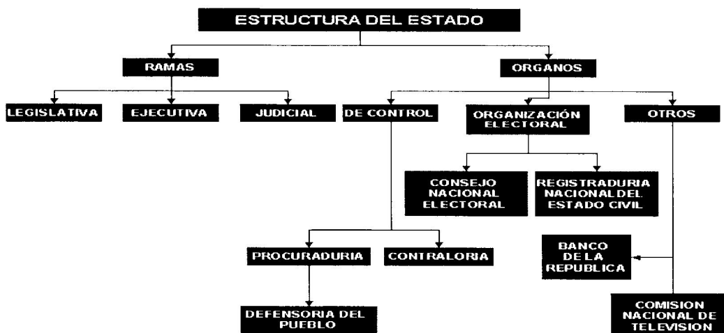
Imagen 2. Estructura del Estado Colombiano

Por lo nombrado, la Registraduría, representa un papel importante en las elecciones populares, teniendo relación directa con el voto programático, debido a que es la Registraduría, la entidad competente en cuanto a la obligatoriedad a la hora de presentar un programa de gobierno para los cargos uninominales, como lo son la presidencia, gobernación, y alcaldías municipales y distritales; siendo así, a continuación, se encontrara un mapa conceptual con la estructura del Estado, vislumbrando el lugar que ocupa la Registraduría Nacional en él, este punto es importante ya que permitirá conocer de dónde nace la Registraduría, de que órgano depende y con qué entidades se asocia.