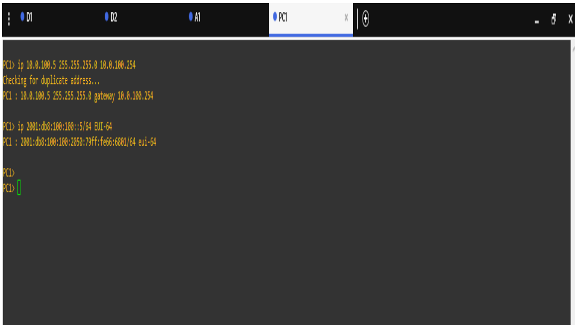
Figura 10: Configuración de direccionamiento IP del PC 1.

PC4> ip 10.0.100.6 255.255.255.0 10.0.100.254 Checking for duplicate address... PC1 : 10.0.100.6 255.255.255.0 gateway 10.0.100.254