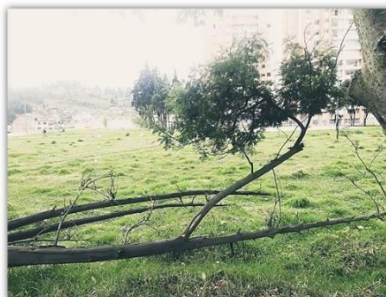
Zona social y natural-Barrio los héroes Duitama Autor: Tatiana Manchego

“Después de sentirte quebrantado, desolado y silenciado por el terror de aquel combate, tratas de reponerte de las heridas de frustración, de dolor y de desesperación. Te arriesgas a formar parte de lazos comunitarios de apoyo y de transformación que te impulsan a afrontar las adversidades y situaciones vividas a través de la esperanza y la comprensión inspirándote a confiar nuevamente en sentirse con la capacidad de hacer algo más por vivir y continuar.”