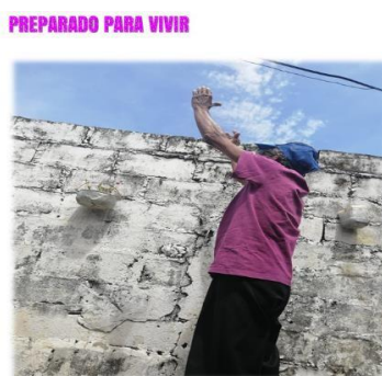
Figura 4. Fotografía “Preparado para Vivir”. Foto Voz

*Así me siento hoy, con ganas de apoderarme de cada oportunidad que me brinda la vida, con cada etapa vivida y superada. Porque siento que lo hago bien, así que me levantaré y agradeceré al cielo por esta libertad muy lejos de la cautividad en la que me encontraba, la humillación, la culpa, el maltrato y abandono. Puedo Mostrarme porque soy la protagonista de mi nueva historia. Rito, no cada vez que lo quiera, en mi hoy no hay nadie que pueda detenerme.*