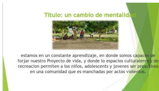
Figura 5. Fotografía “Un cambio de Mentalidad”. Foto Voz

Nota. La figura 5 es resultado del Ejercicio de Foto Voz, Autor(a): Marlys Ordoñez