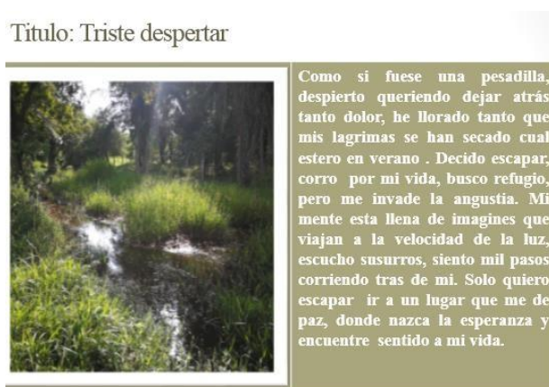
Figura 2. Fotografía “Triste Despertar”. Foto Voz.

Nota. La figura 2 es resultado del Ejercicio de Foto Voz, Autor(a): Deisy Magaly Llanes.