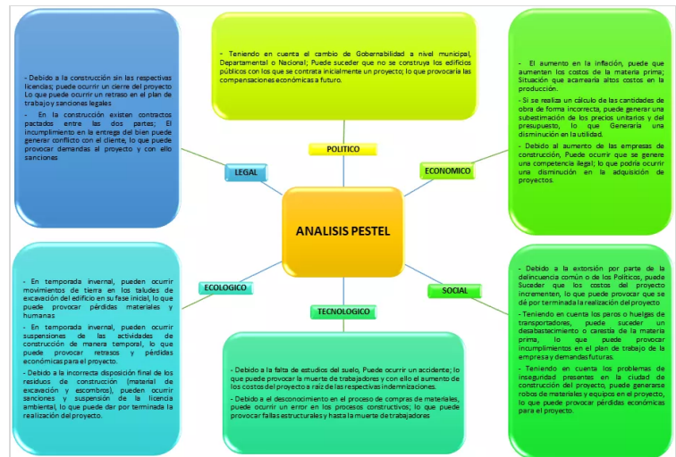
Mapa de Riesgos del SIG