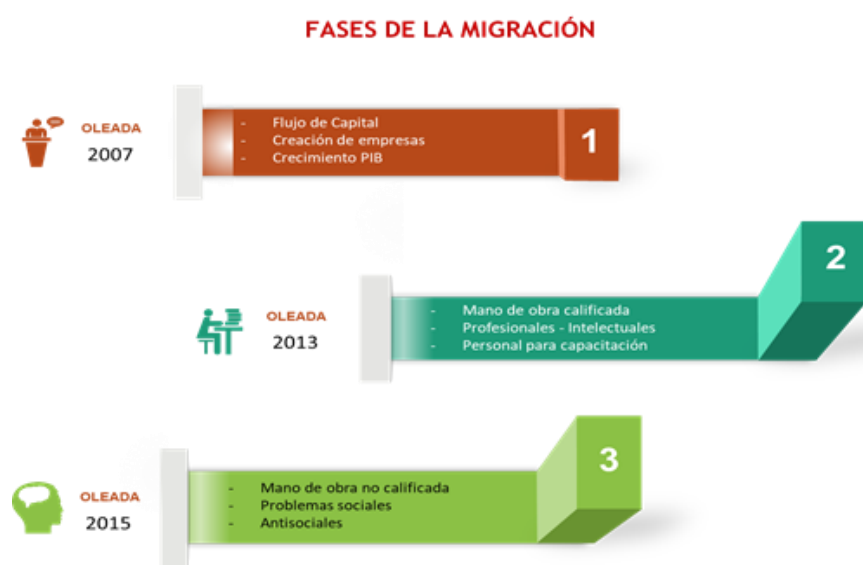
Figura 1. Fases de migración venezolana

Nota: la figura representa las diferentes fases de las oleadas de migrantes venezolanos, siendo estas fases aquellas que han afectado la economía.