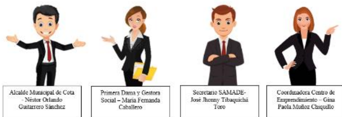
Figura 2. Gráfico - Matriz de liderazgo