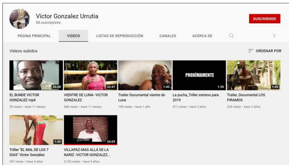
Figura 1. Canal de YouTube Víctor Gonzales Urrutia. (2021) [Captura de pantalla].

https://www.youtube.com/channel/UCOhWjYqx0YupmRjwJ8GCzyQ/videos