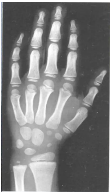
Imagen de referencia de un niño de 5 años.