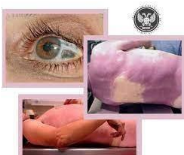
Imagen de clasificación de fenómenos cadavéricos.