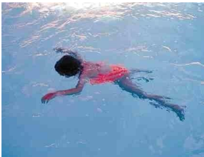
Imagen de referencia de un niño en una alberca.