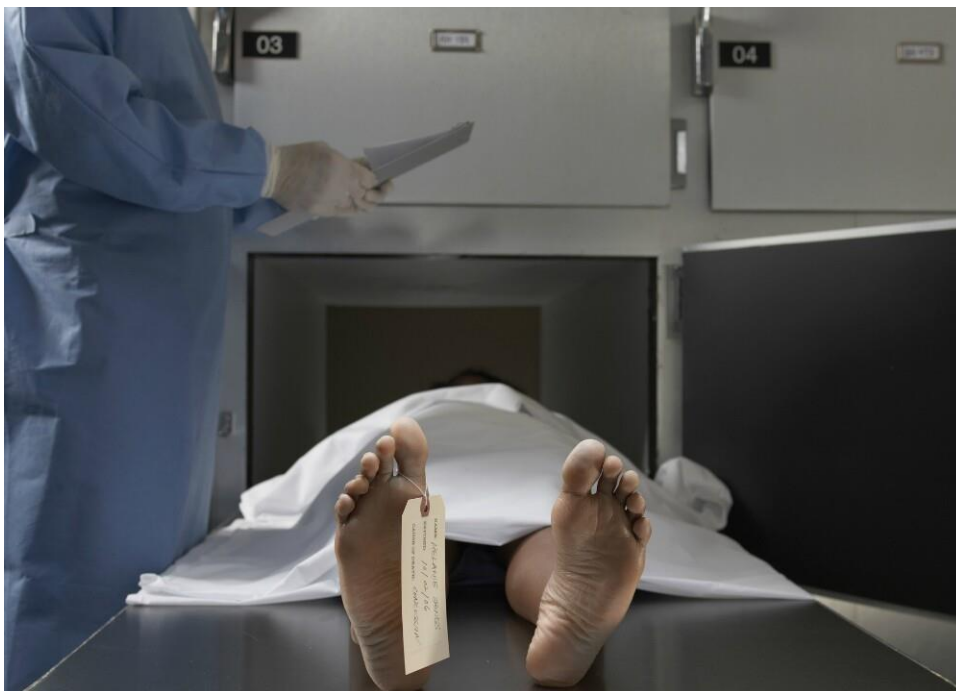
Imagen de referencia de un cuerpo en la morgue, rotulado y con custodia.

Fuente: - Ratas se comieron varias partes de un cuerpo en la morgue de un hospital(2010)