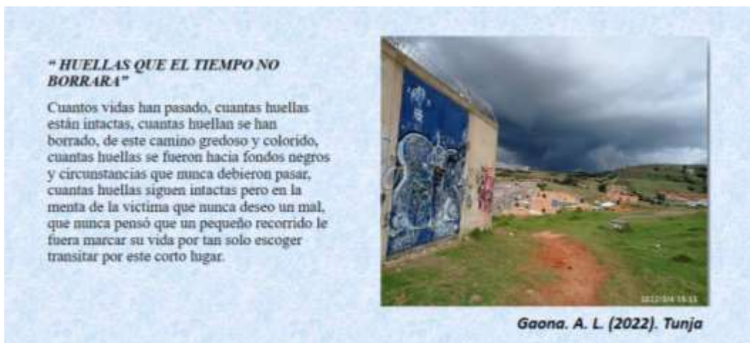
Figura 2. Fotografía “Huellas que el tiempo no borrara” foto voz

Dentro de cada una de las imágenes y con la asociación a cada una de los tipos de violencia expuestos dentro de la fotovoz, logramos resaltar y dar significados más profundos, de los cuales otros sujetos del común no aportarían, por ejemplo, la silla vacía, el mural de memorias, caminos olvidados, las casas en ruina, las botas desempolvadas, los rostros de enojo, tristeza, desolación, abandono.