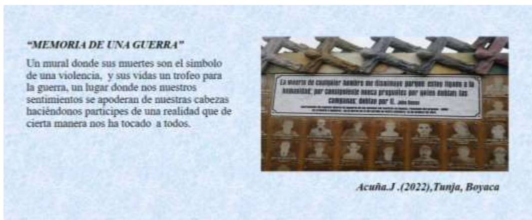
Figura 4. Fotografía “Memoria de una guerra” foto voz

El conflicto armado en Colombia, según la Red Nacional de Información (2017) con corte a 01 de noviembre de 2017, ha dejado más de ocho millones y medio de víctimas en el país y daños de diversa índole. El Grupo de Memoria Histórica (2013) ha clasificado los daños del conflicto armado en Colombia en cuatro categorías: daños emocionales y Psicológicos, daños morales, daños políticos y daños socioculturales. (Vásquez et. al, 2019, p. 363).