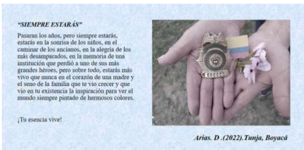
Figura 1. Fotografía “Siempre Estarás” foto voz

Estas imágenes expresan esa memoria de los hechos a través de los años, esa memoria colectiva, social, comunitaria, individual, marcada por la violencia, la desigualdad de derechos, la guerra, la marginación que viven las poblaciones vulnerables de nuestro país. Jimeno (2007) afirma: