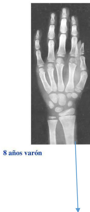
Imagen comparativa del atlas de greulich y pyle