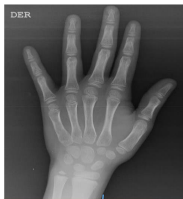
Imagen del caso