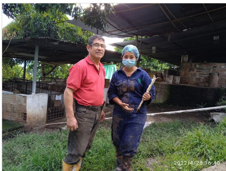
Figura 4: Registro sanitario del predio