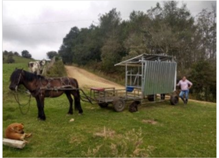
Figura 10. Ordeño mecánico