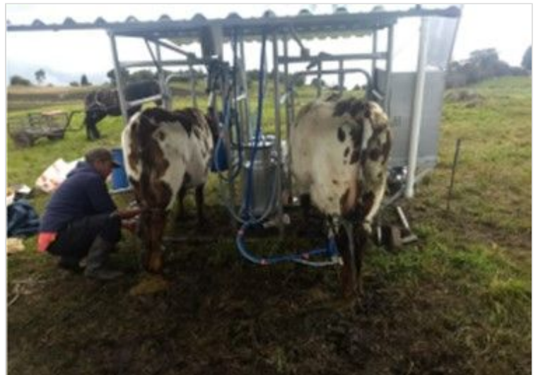
Figura 11. Actividad de ordeño