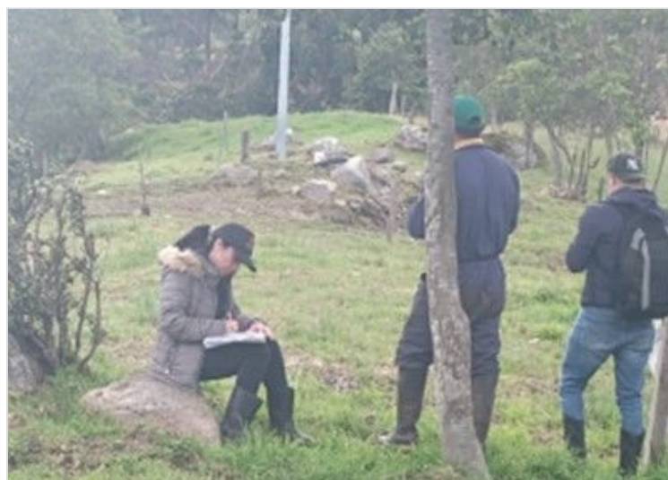
Figura 6. Reconocimiento praderas de la finca