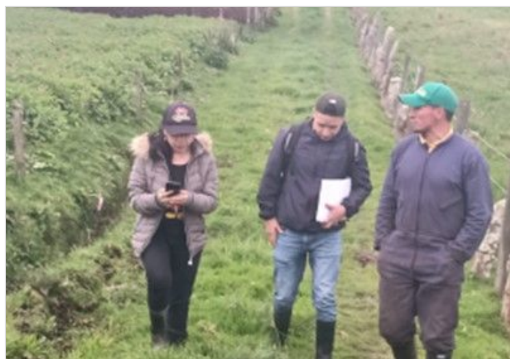
Figura 5. Recorrido por las praderas