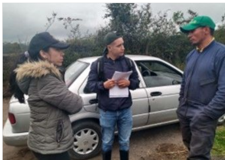
Figura 4. Entrevista propietario de la finca