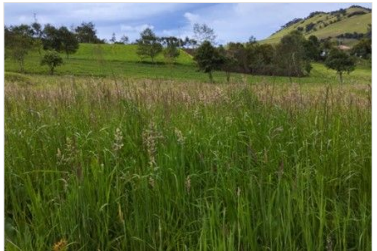
Figura 15. Forrajes del predio