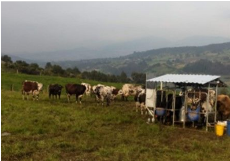
Figura 9. Zona de ordeño