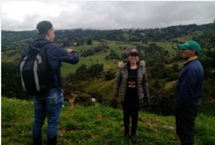
Figura 8. Visita parte alta de la finca