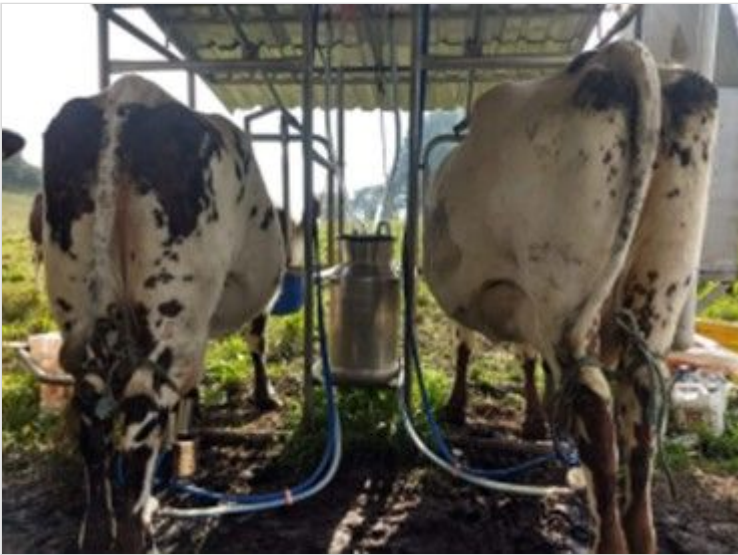
Figura 13. Actividad de ordeño