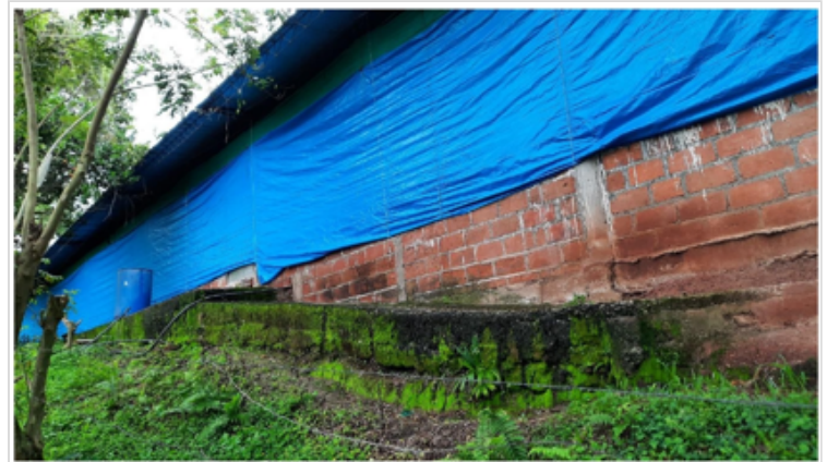
Figura 4. instalaciones granja san Antonio

JHAXON JHOANY MENDEZ RICO 13 DE JULIO DE 2022 23:18