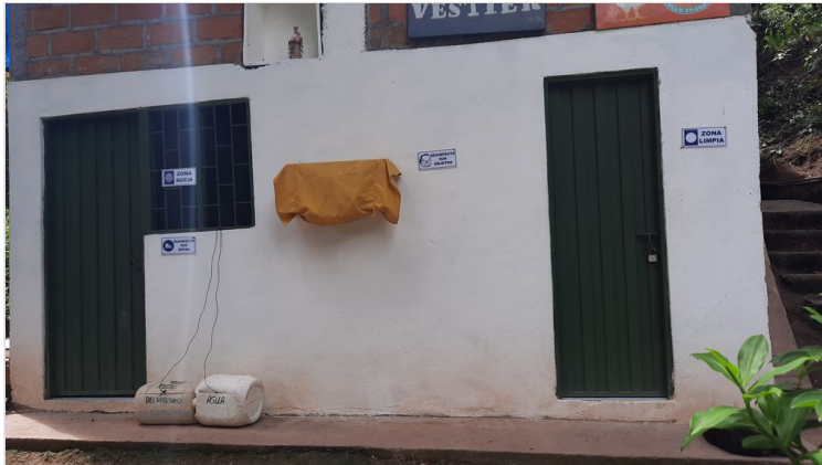
Figura 1. instalaciones granja san Antonio

JHAXON JHOANY MENDEZ RICO 14 DE JULIO DE 2022 00:47