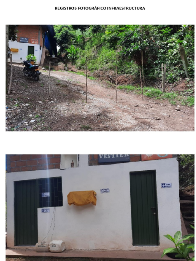
Figura 2. instalaciones granja san Antonio

JHAXON JHOANY MENDEZ RICO 13 DE JULIO DE 2022 23:18