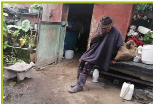
Uribe, A. (2022) Afectaciones

El dolor que produce, la violencia queda atrapado y guardado en el fondo del baúl de la memoria. Arrancándome de las entrañas las ganas de vivir, mi autoestima, el deseo de superarme y socializar con los demás.