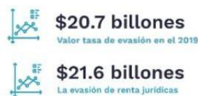
Tasa de evasión en Renta - Jurídicas 2015 - 2019