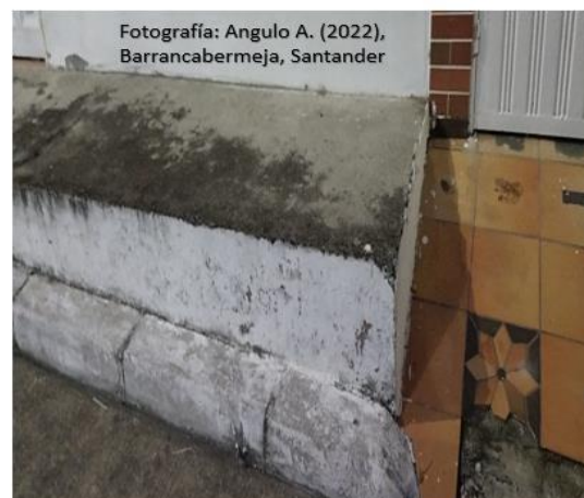
Vestidos De Sangre

Parece mentiras que en un lugar donde la cotidianidad era la charla amena entre amigos, vecinos y familiares este ahora lleno de dolor, de manchas dejadas por la sangre que ha traído la guerra minuciosa del microtráfico donde son muchos los que exponen su vida y pocos los que arriesgan su plata, “el pasado siempre fue mejor” dice un famoso refrán. Pero en este caso el pasado en este lugar será recordado como símbolo de tristeza y desolación por quienes lloran a su ser querido y por quienes traerán a colación lo que en algún momento sucedió, los días dejaron de estar llenos de claridad ahora están vestidos de oscuridad y de muerte, en cuanto a esto sucede cada habitante se pregunte ¿Cuándo volverán tiempos mejores?, ¿Hasta cuando viviremos con la tranquilidad y la paz que durante un tiempo estuvo y que ahora solo es un recuerdo de aquello que fue y que por ahora no se sabe si volverá.