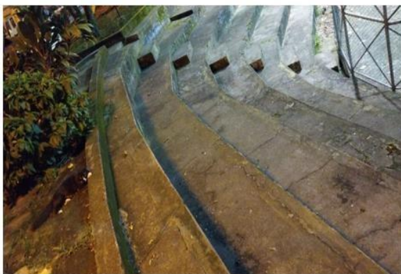
Fotografía: Angulo A. (2022), Barrancabermeja, Santander

Los caminos en los que hemos estado están denotados por altas y bajas, momentos por los cuales todos han tenido que pasar en algún circunstancias por las que muchos han tenido que pasar en algún momento de sus vidas, estos nos llenan de temor y nos hace recaer en una inconstancia de sentimientos que nos abrumba y nos lleva a pensar en lo insaciable en que pasara en los siguientes años con la vida, con los proyectos que también van por un sendero incierto, debido al ahogo y a la tristeza profunda de el sin sabor que deja el estar siempre en los mas bajos, pero también permite resurgir subir peldaño a peldaño y ser resilientes en medio de la incertidumbre.