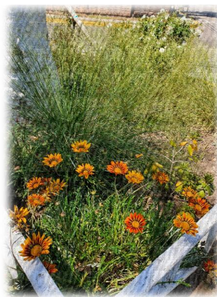
20 de octubre de 2022 La Reina – Santiago de Chile

Brindar nuevas oportunidades a quienes pensaban que la vida no sonreía, que un arma daba poder, riquezas y posición, que creían tener una lucha social pero realmente su descontento fomentaba la injusticia, no se esperan milagros, pero creer que el cambio es posible, es el mayor avance.