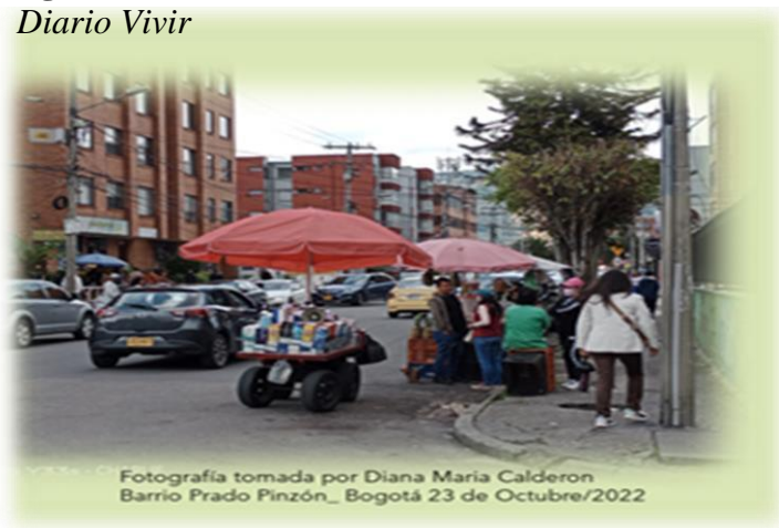
Figura 1 Diario Vivir

Contexto de la ilustración No 1: presentamos al barrio Pinzón en la localidad de Suba en Bogotá, en un sector residencial con comercio, parques y espacios públicos, se presentan hechos de violencia como robos, asaltos y hechos de inseguridad que preocupa a los habitantes de la zona.