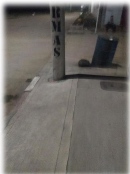
19 de octubre 2022

“Las noches son testigo de momentos de angustia, dolor, lagrimas, temor, gritos de padre o madre que llega de su trabajo, cansado después de un día normal como el resto de los días de la semana, o tal vez de estrés; o el adolescente o estudiante que llega de la universidad o del colegio; o del domiciliario que trae algún pedido que realizó algún vecino del barrio”.