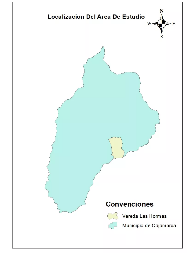
Figura 3: (Perilla C. 2022). Área de Estudio Vereda Las Hormas- Municipio de Cajamarca.

La hacienda ganadera “Las Perlas” tiene una extensión de 678 Ha, está ubicada en la cabecera de la vereda las hormas del municipio de Cajamarca Tolima, a una altura de 2840 m.s.n.m, siendo la tipología del terreno de ladera u ondulada, donde se cuenta con un sistema de conservación de bosque que ocupan 250 Ha y 428 Ha para uso de ganadería; además, se ubican importantes reservorios de agua que pueden oscilar entre 40 a 43 nacimientos en la zona de protección, cuenta con especies forestales maderables que son usadas para trabajos dentro de la finca.