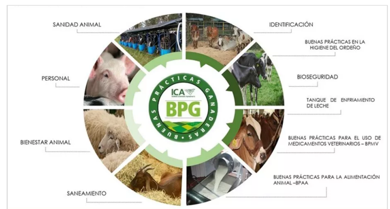
Figura 1: ICA (2022) Buenas Practicas Ganaderas.

Las Buenas Prácticas Ganaderas – BPG son las prácticas recomendadas que tiene el propósito disminuir los riesgos físicos, químicos y biológicos en la producción primaria de alimentos de origen animal que puedan generar riesgo a las personas promoviendo la sanidad, el bienestar animal y la protección del medio ambiente. (ICA, 2022)