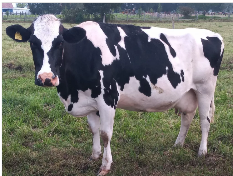
Figura 1.Velandia,J. (2022) bovino [Fotografía].