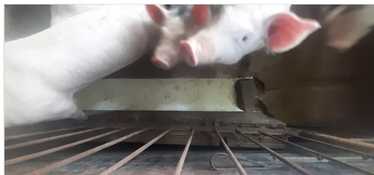
Figura 5, Goyeneche, S. (2022). Comederos Jalisco [Imagen]