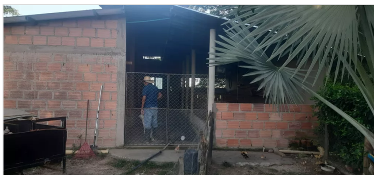
Figura 4. Goyeneche, S. (2022) Instalación Granja Jalisco [Imagen]

SANDRA MILENA GOYENECHÉ ESPINOSA 15 DE DICIEMBRE DE 2022 10:14 UTC