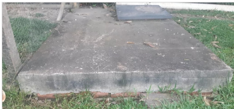
Figura 6. Goyeneche, S (2022) Pozo septico [Imagen]