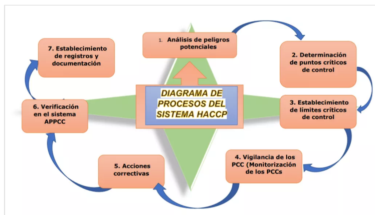
Figura 2. Goyeneche, S. (2022) Diagrama de Procesos Sistema HACCP [Diagrama]