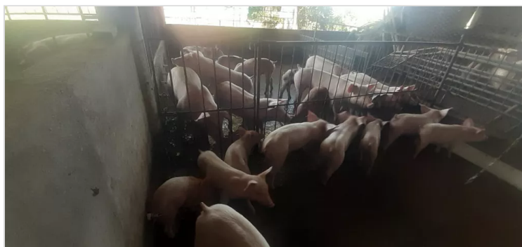
Figura 10, Goyeneche, S. Precebos Granja Jalisco [Imagen]

SANDRA MILENA GOYENECHÉ ESPINOSA 15 DE DICIEMBRE DE 2022 11:37 UTC