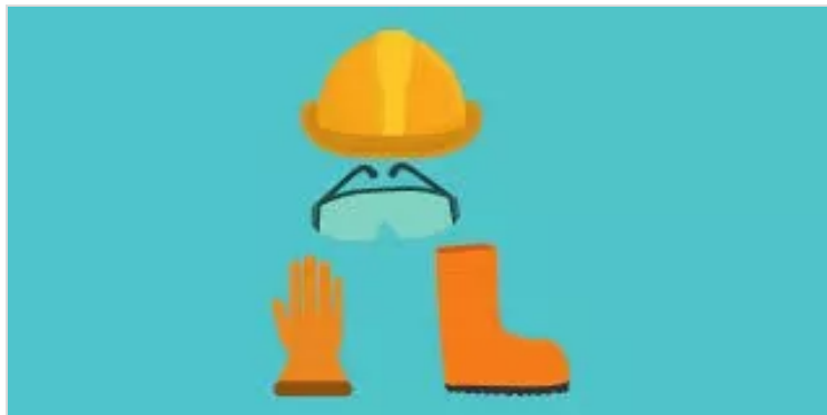
Figura 8. Goyeneche, S (2022) Fomites [Imagen prediseñada]

SANDRA MILENA GOYENECHÉ ESPINOSA 11 DE DICIEMBRE DE 2022 08:27 UTC