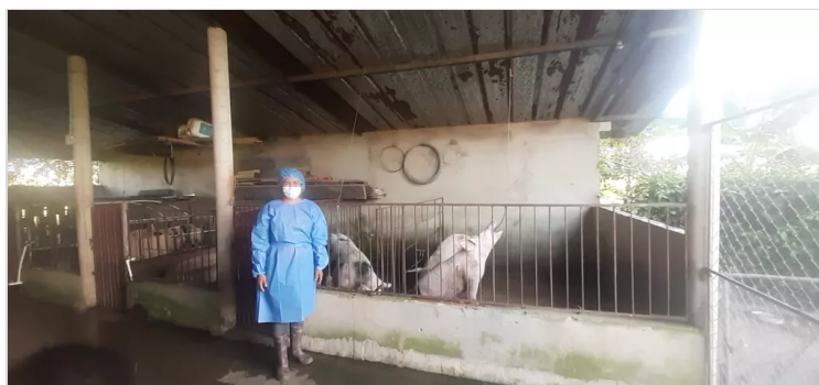
Figura 9. Goyeneche, S. (2022). Personal usando EPP [Imagen]

SANDRA MILENA GOYENECHÉ ESPINOSA 15 DE DICIEMBRE DE 2022 11:18 UTC