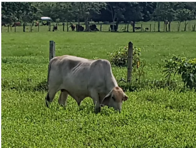
Figura 9: Hernández, M. (2022), Forraje, Finca la Antioqueña.