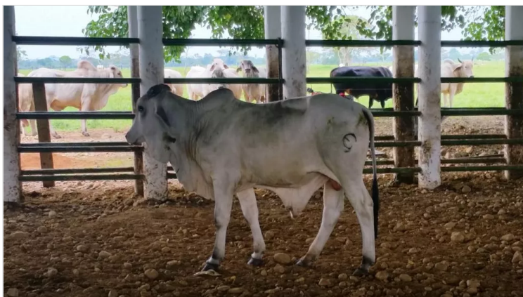
Figura 5: Hernández, M. (2022), Marcación individual de animales, Finca la Antioqueña.