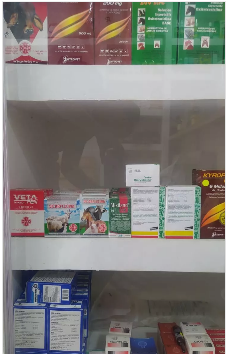
Figura 8: Hernández, M. (2022), Vitrina de productos veterinarios, Finca la Antioqueña.

La finca conserva los productos veterinarios en un lugar fresco los cuales se encuentran con fecha de vencimiento larga y en buen estado. A la hora de administrar los medicamentos se cuenta con un veterinario que considera la dosis y vía de aplicación indicada por la etiqueta respetando el tiempo de retiro en carne.