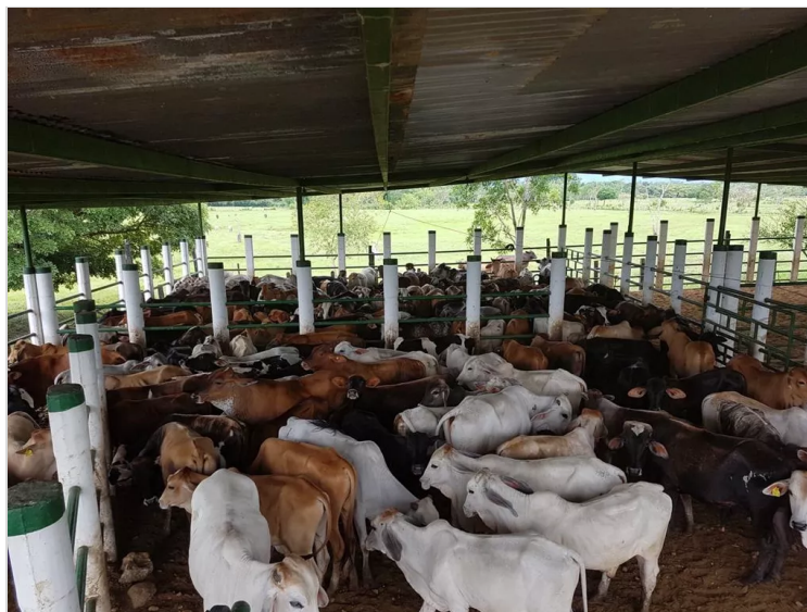
Figura 3: Corrales, Finca la Antioqueña.