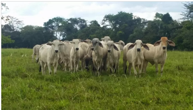
Figura 7: Hernández, M. (2022), Praderas, Finca la Antioqueña.

Los animales enfermos se deben tratar de manera inmediata por un médico veterinario debido a que es el derecho a una de las 5 libertades del bienestar que es gozar de buenas condiciones saludables, también necesitan tener libre acceso al agua y comida para suplir las necesidades que requieren, de igual forma no causar dolor a los animales con procedimientos innecesarios.