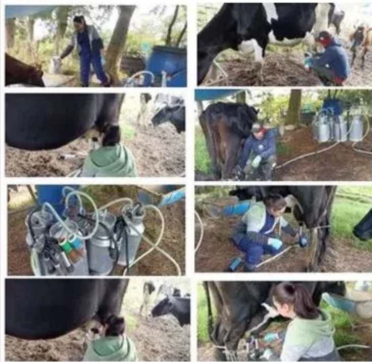
Figura 3. Proceso de Ordeño

El Proceso de Ordeño es realizado en los potreros, allí se destina un espacio para iniciar toda la rutina, en este se debe garantizar que el espacio este limpio; el tipo de ordeño es de manera portátil lo que permite que sea movilizado por toda la finca, se realiza verificación de que este se encuentre limpio y sin ningún residuo, se prosigue el arreo de la vaca y posteriormente se procede a lavar los pezones con una solución yodada y se realiza el secado con papel periódico de ahí se continua con el despunte que consiste en depositar los tres primeros chorros de leche en un recipiente negro para verificar la consistencia de la leche, se colocan las pezoneras para iniciar la extracción de la leche al vacío, al finalizar se verifica que no quede leche en los pezones y se realiza el sellado para evitar la entrada de algún patógeno que puede afectar a la vaca. Luego de la rutina de ordeño esta se deposita en un tanque de enfriamiento para que se conserve a una temperatura de 4°C allí se debe colar la leche con el fin de evitar la caída de cualquier solido a la leche y a su vez se realiza lavado y desinfección de los utensilios para el siguiente ordeño.