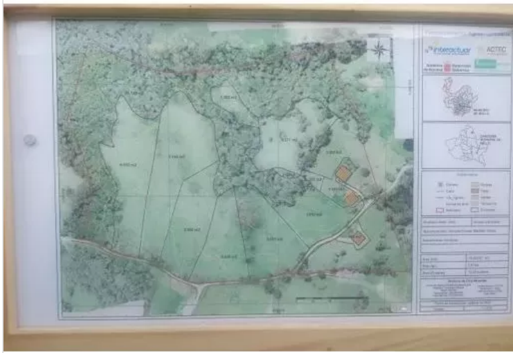
Figura 1. Localización Finca Honduras