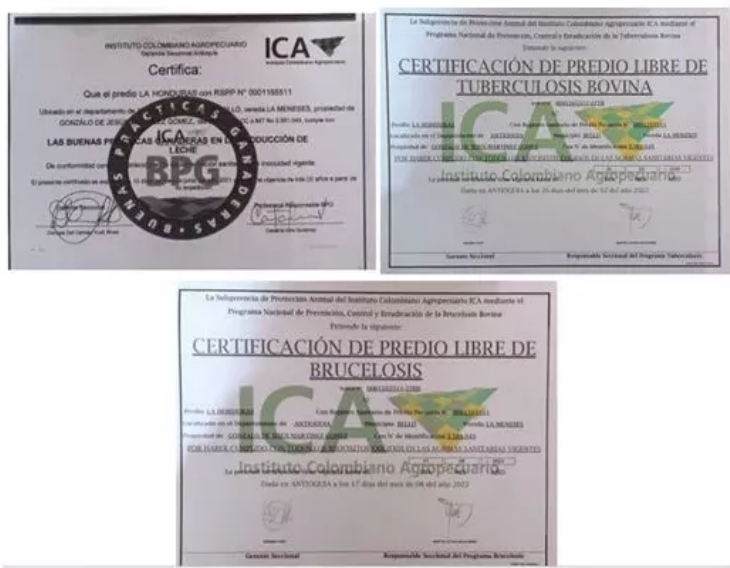
Figura 4. Certificaciones

desempeño de los procesos de producción de la finca.