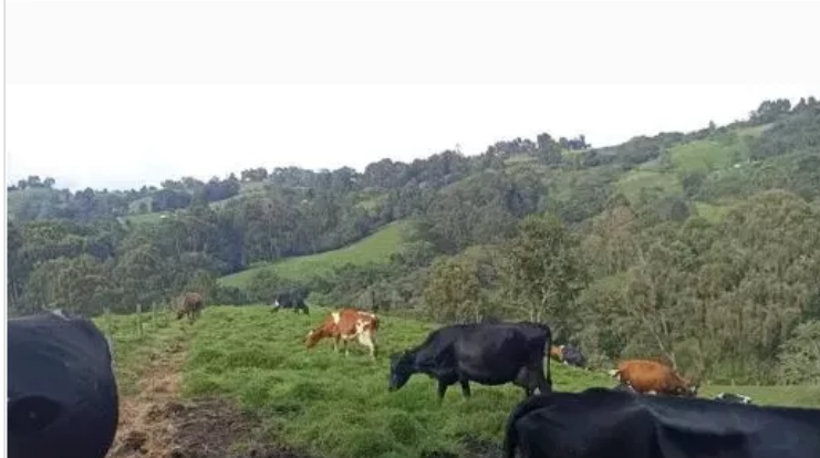
Figura 2. Visita Finca Honduras

El sistema de reproducción que se maneja en la finca es por medio de inseminación artificial, donde se encuentra que la edad para el primer servicio es de 17 meses con peso aproximado de 300kg, y presenta un porcentaje de fertilidad del 80 % y de natalidad de un 100% las crías nacen con un peso promedio de 35kgs, que a su vez son comercializadas para sacrificio a la empresa Colanta, el rebaño actualmente tiene una edad promedio de 4 años y su vida útil es de 5 partos.