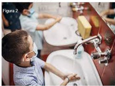
Hand Hygiene at School. (2021, 25 agosto). Centers for Disease Control and Prevention. https://www.cdc.gov/handwashing/esp/handwashing-school.html