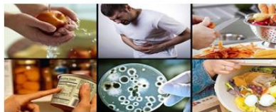
Adn40, R. (2020, 9 julio). Al año mueren 420 mil personas por alimentos contaminados: ONU . ADN40. https://www.adn40.mx/noticia/salud/notas/2019-06-08-06-00/al-ano-mueren-420-mil-personas-por-alimentos-contaminados-onu