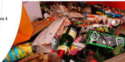
¿Por qué es importante la gestión de residuos? (2016, 2 diciembre). iResiduo. https://iresiduo.com/noticias/espana/agresur/16/12/02/que-es-importante-gestion-residuos