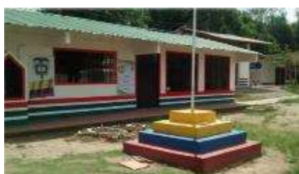
Centro Educativo Puerto Lucas. Sede Principal.