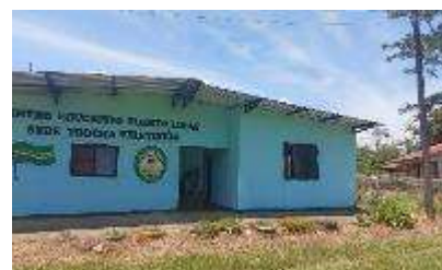
Sede Trocha 26