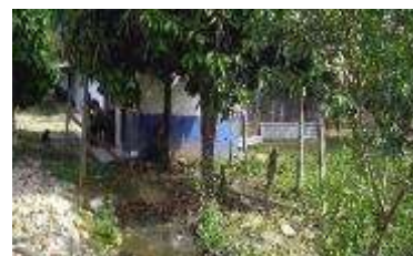
Sede Progreso del Guejar