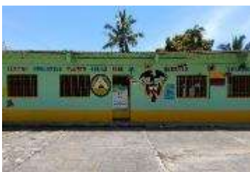
Sede La Albania