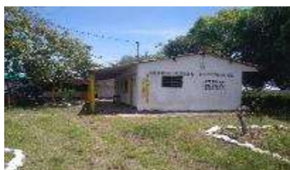
Sede La Marina