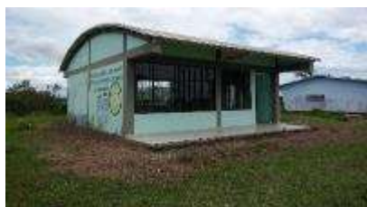
Sede San José de Jamuco