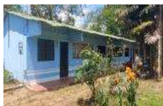
Sede Puerto Esperanza