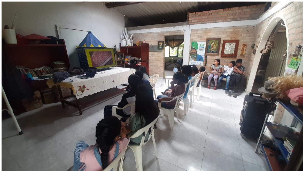
Fotografía 4: Uso y apropiación de las Tecnologías de Información y Comunicación TICs para el ejercicio educomunicativo.

En el área de capacitación en ecología se relacionó que se tratarían los temas: recursos naturales agua, flora, fauna, aire, tierra; la contaminación, calentamiento global, cambio climático, alternativas en desarrollo sostenible, reforestación, restauración ambiental, aprovechamiento de residuos sólidos, las energías alternativas, aprovechamiento alternativo de las especies animales y vegetales, la adaptación al cambio climático. Los participantes con los conocimientos adquiridos y propios realizaran un trabajo ambiental en la comunidad, el cual socializaron con el grupo por medio de video en WhatsApp y exposición presencial.