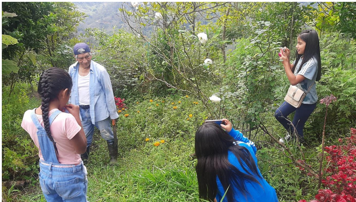
Fotografía 5: Trabajo de campo implementando conocimientos adquiridos para la generación de contenidos educomunicativos (Fuente: Arles Porras, 2022).

Se habló de principios de fotografía y leyes, el objetivo es diferenciar los diferentes tipos de comunicación y los tipos de planos en fotografía, y planos en video y movimientos en video se divide el grupo 4 subgrupos oral, escrito, fotográfico y audiovisual; los resultados del trabajo en grupo oral exposición no más de un minuto, escrita un párrafo, fotográfico 4 fotografías y audiovisual un video de 1 minuto; todos estos trabajos deben explicar que es la biblioteca el Hogar de los Libros para ellos