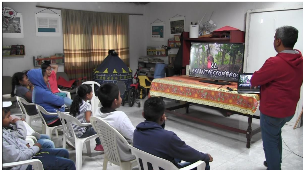
Fotografía 3: Socialización del video espanta escombros con los niños y los padres de familia asociados a la biblioteca El Hogar de los Libros (Fuente: Arles Porras, 2022).

es cuando él mismo la comprende y la aprehende verdaderamente” (Fotografía 3).