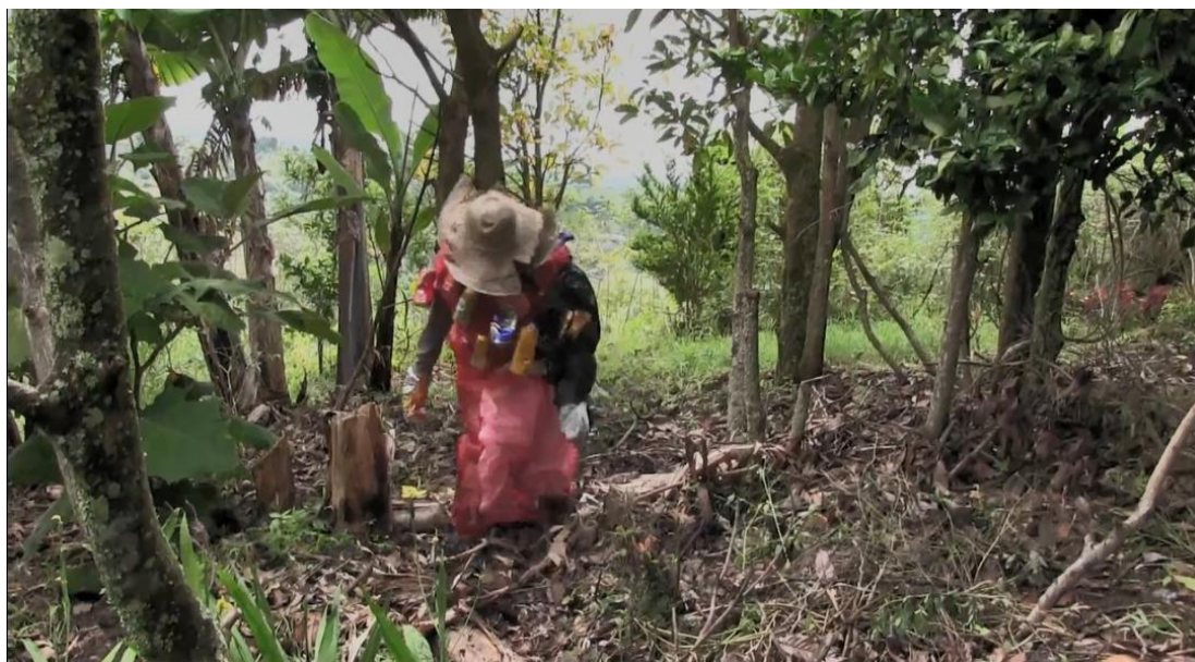
Fotografía 10: Personaje Espanta Escombros, preparado para el rodaje final

mismos y con los demás, y que la comunicación puede ser verbal cuando hablamos o leemos, y no verbal cuando hay dibujos o un semáforo, por ejemplo. Con ayuda del dinamizador, quien direccionó con preguntas, los niños hablan de los medios tradicionales de comunicación como la radio y la televisión, que nunca dicen nada de su vereda, pero que existe la internet donde ellos pueden hablar de su vereda al Mundo, y no solo ver videos o subir fotos al Facebook . Los niños dicen que quieren hacer un video de sus problemas ambientales y paisajes de la vereda para que el mundo conozca la biblioteca El Hogar de Los Libros (Fotografía 10).