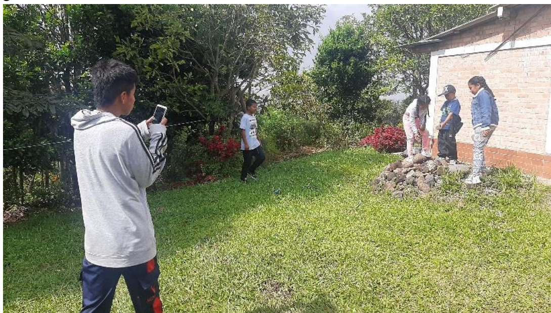
Fotografía 12: Grabación del video del espanta-escombros, en locaciones externas.

El Ministerio de Ambiente y Desarrollo Sostenible colombiano 2005 tiene entre sus metas la inclusión de la educación ambiental tanto en lo formal como en lo informal y no formal, como un aporte al desarrollo sostenible y al mejoramiento de la calidad de vida de los colombianos, conservando sus riquezas naturales y recuperando ecosistemas, por el bien de las próximas generaciones.